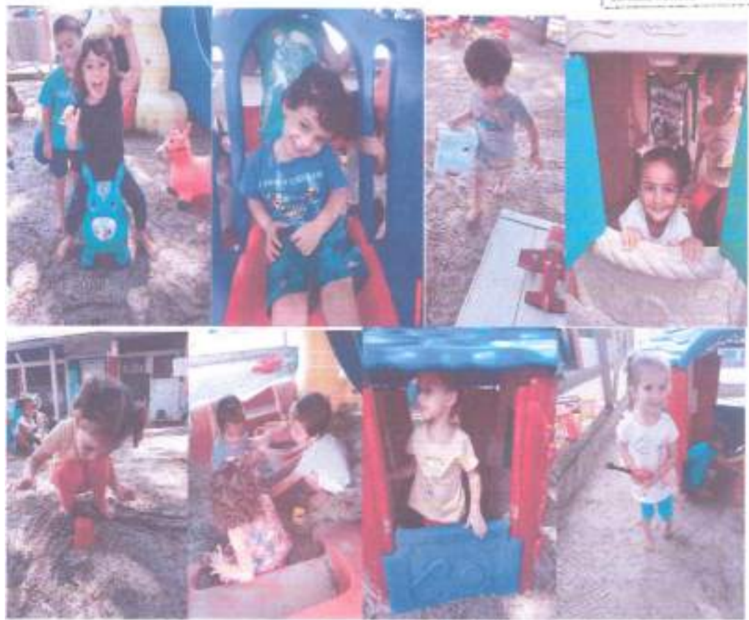
Primeiro dia a gente nunca esquece!!!