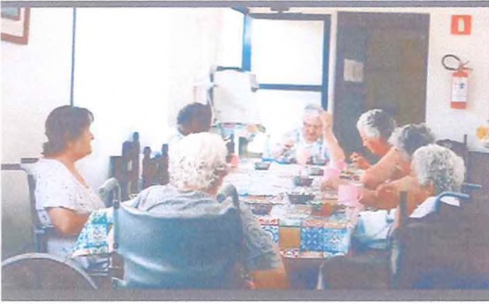
Parte das idosas acolhidas