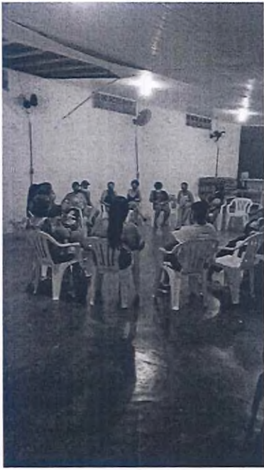
Encontro com as famílias