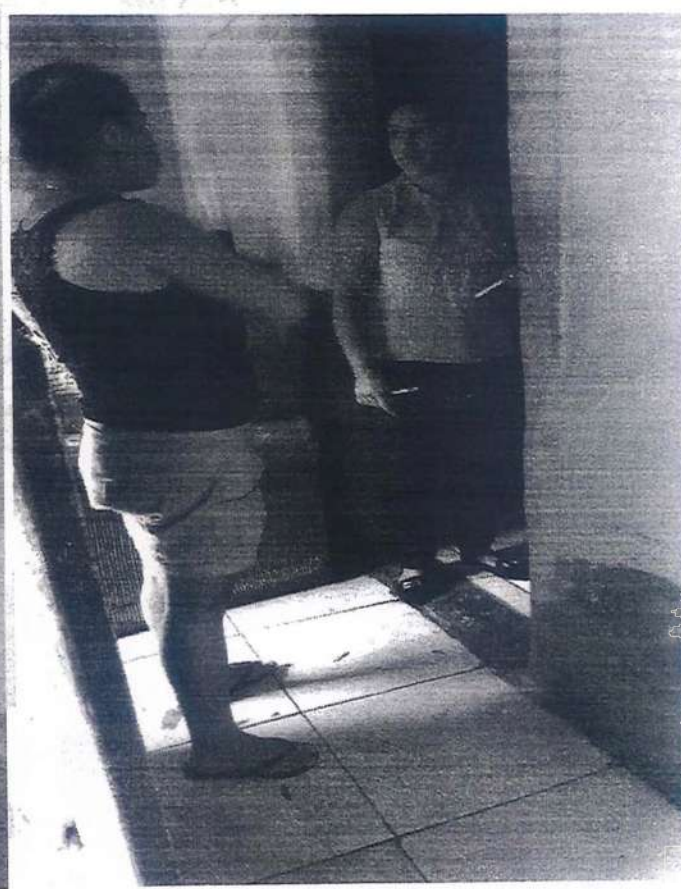
Visita social realizada pela assistente social, para famílias de usuários da APAE.