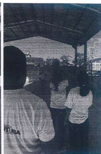
Esporte, atividade física, natação e volei.