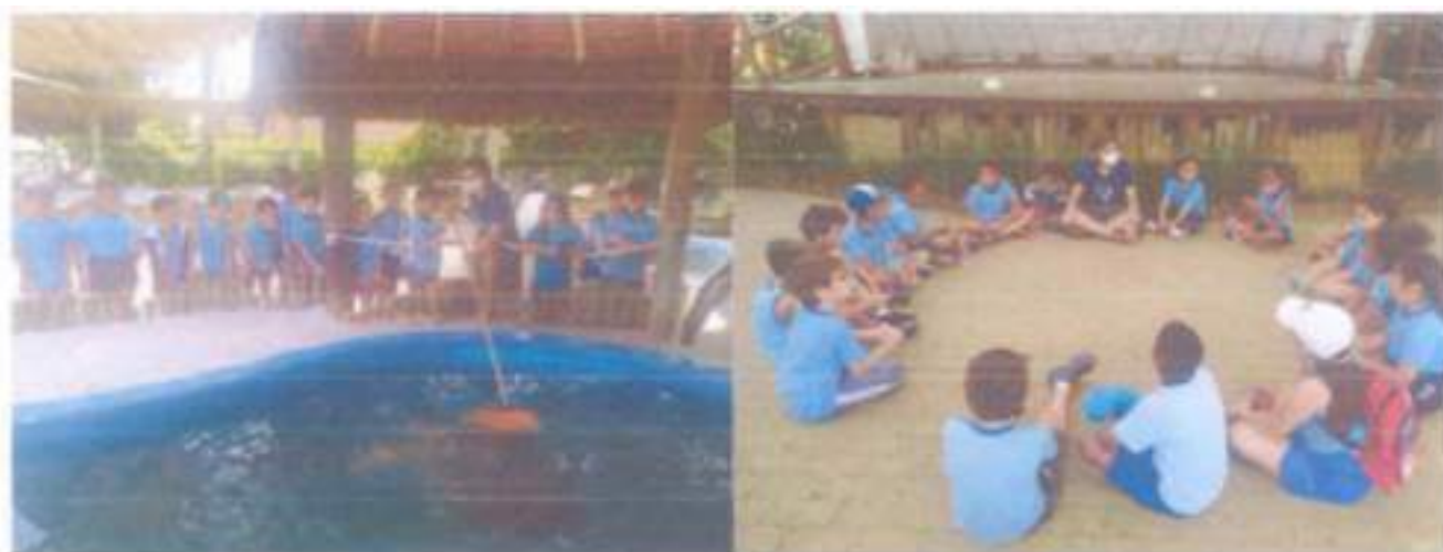
Foto: Atividades do Cuidar do Mar na Escola, com alunos da E.M. Altimira Abirached;