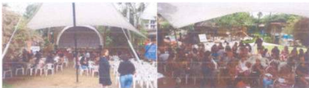
Encerramento com professores da rede pública municipal.

Realizado no período: Evento realizado nos dias 31/novembro. Cessão do espaço e sonorização para realização do evento.