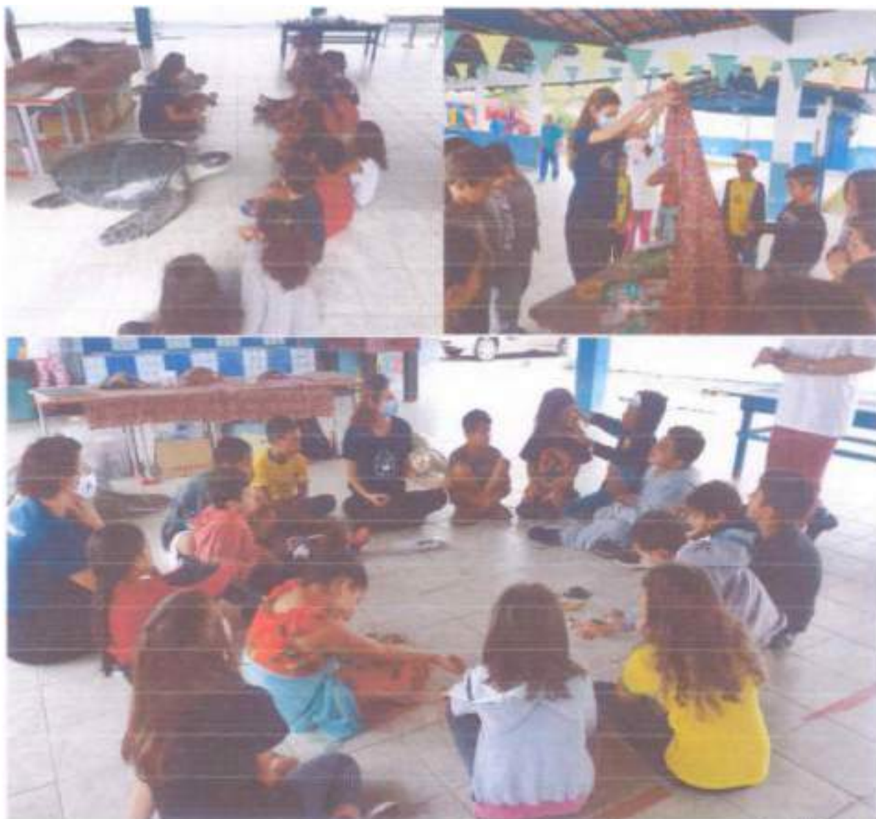
Foto: Atividades na E.M. Nativa F. Faria;