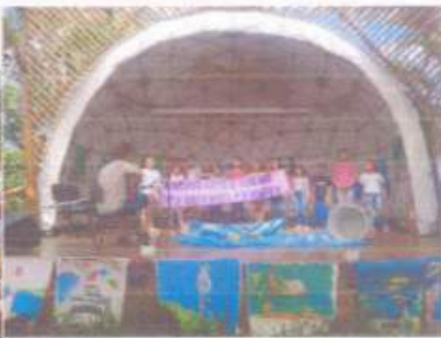
Apresentações para as crianças da rede municipal em ensino do município;