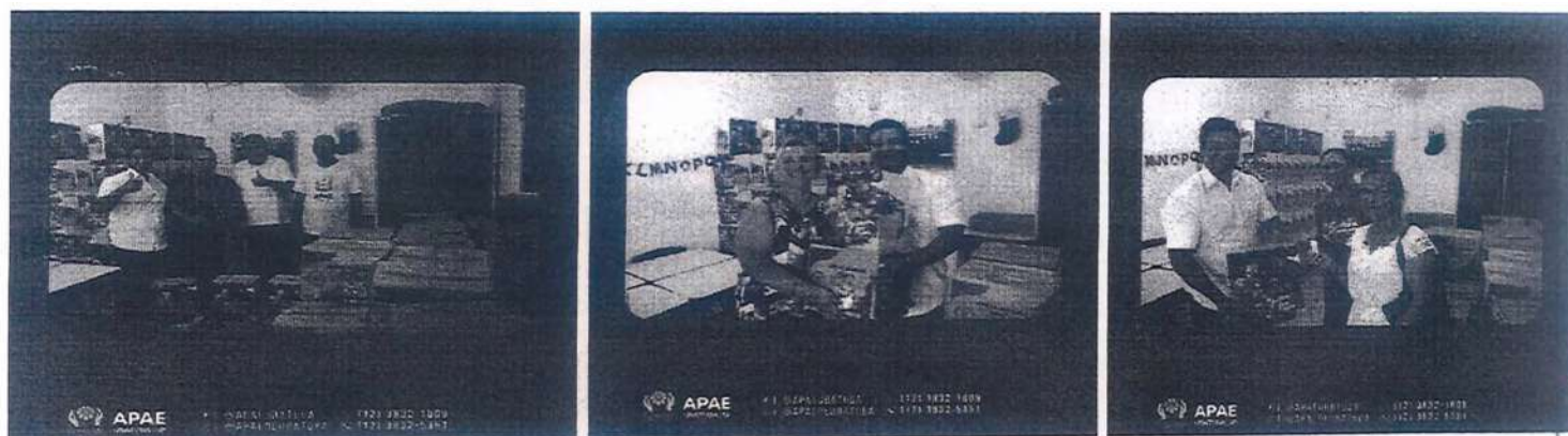
Entrega da cesta e coleta de assinaturas das famílias que retirou a cesta de natal.