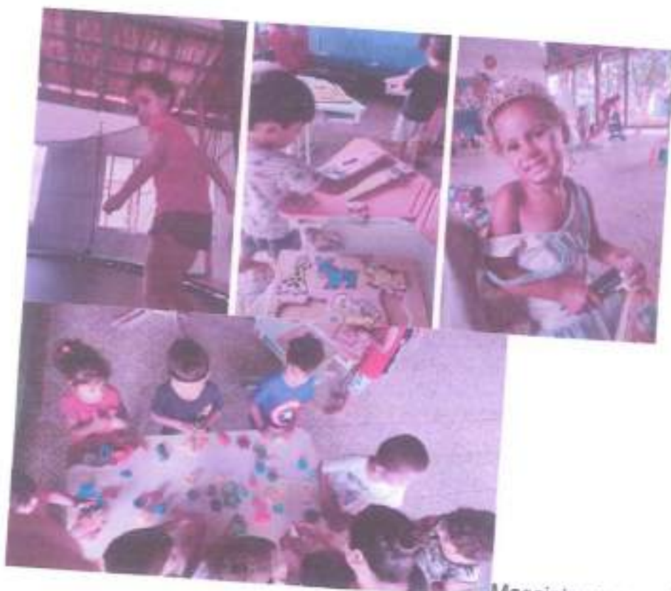
Massinha e suas formas.