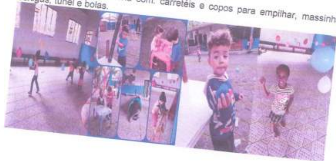
Brincando na área externa com: carretéis e copos para empilhar, massinha, bexigas, túnel e bolas.