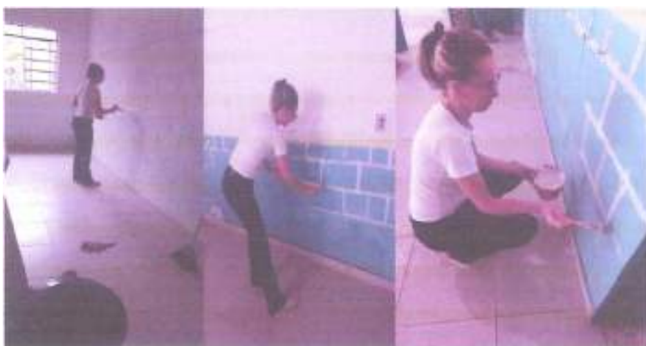
Pintando as salas.

Brincadeira na área externa com: escorredores, brinquedos de praia, velotrol, carretéis para empilhar, cavalinhos e massinhas.