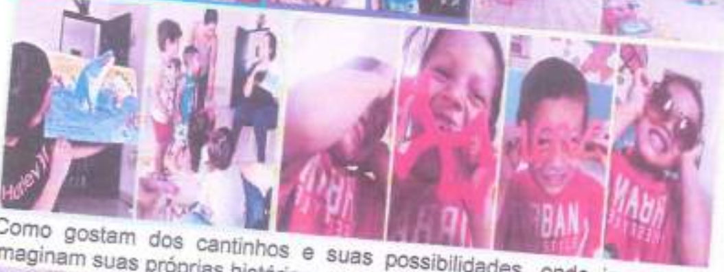
Como gostam dos cantinhos e suas possibilidades, onde inventam, criam, imaginam suas próprias histórias.