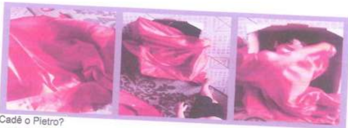
Cadê o Pietro?

Vamos dar banho nas bonecas, trocá-las e pendurar as roupas molhadas.