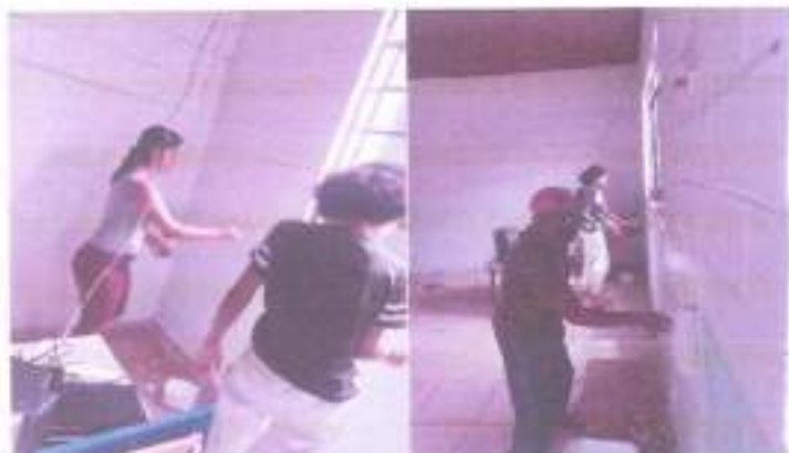
Pintando as salas