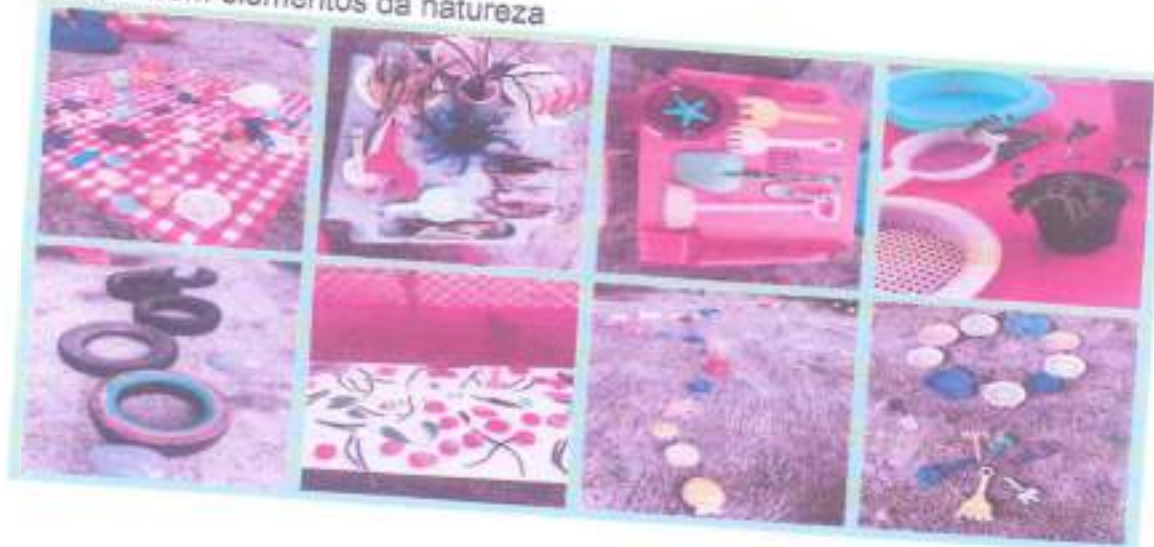
Parque com elementos da natureza