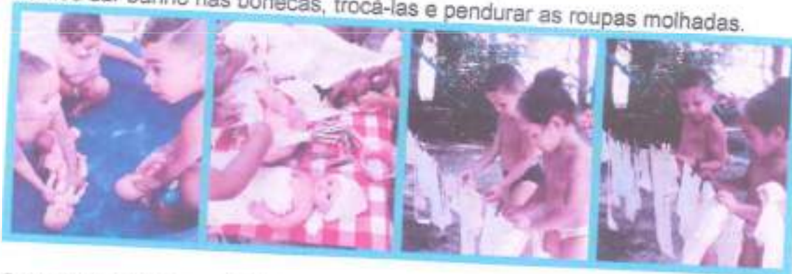
Cantinhos e suas possibilidades

Vamos dar banho nas bonecas, trocá-las e pendurar as roupas molhadas.