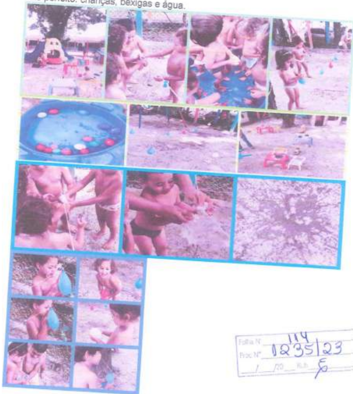
Trio perfeito: crianças, bexigas e água.