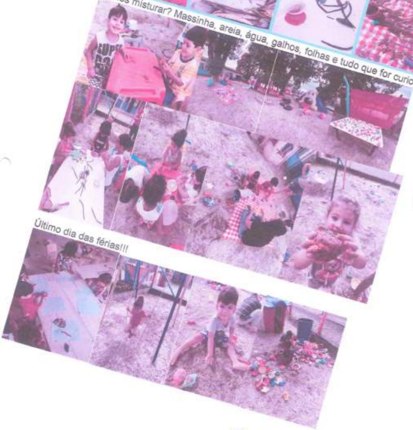
Último dia das férias!!!