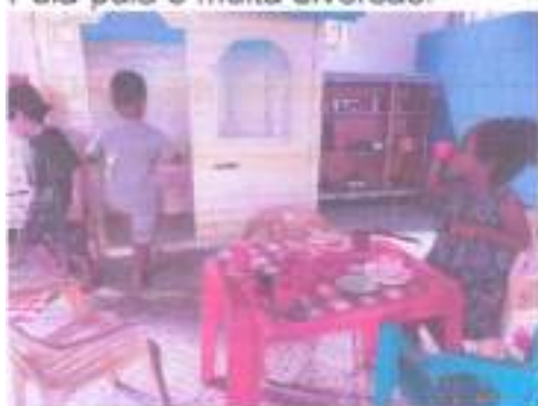
Nossa cozinha "com muitas gostosuras".