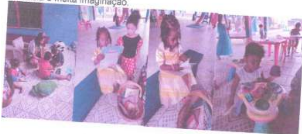
Fantasia e muita imaginação.