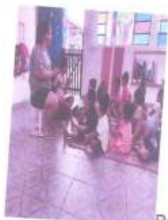
Roda de conversa