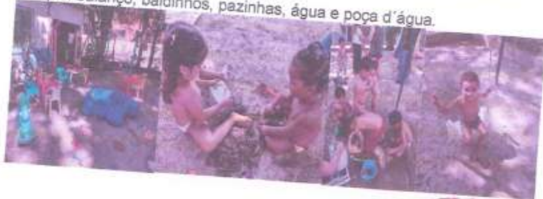
Parque: balanço, baldinhos, pазinhas, água e poça d'água.