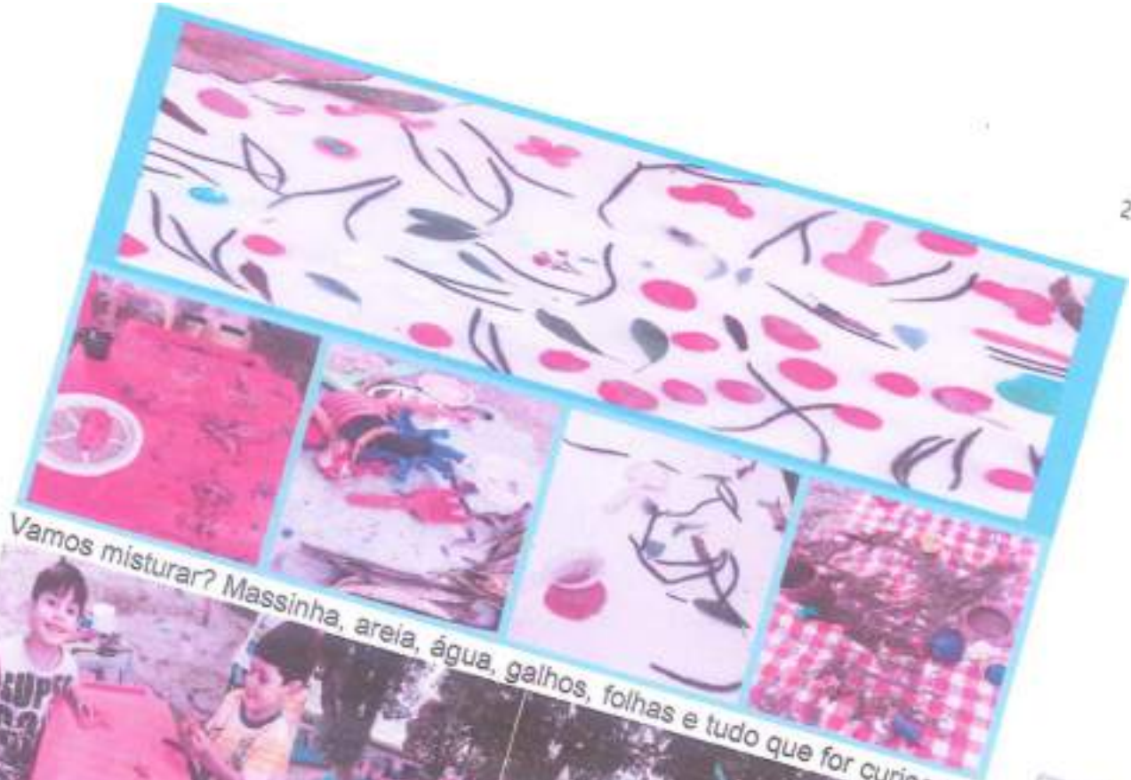
Vamos misturar? Massinha, areia, água, galhos, folhas e tudo que for curioso.