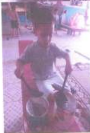
Quem disse que Gabriel não tem uma bateria.