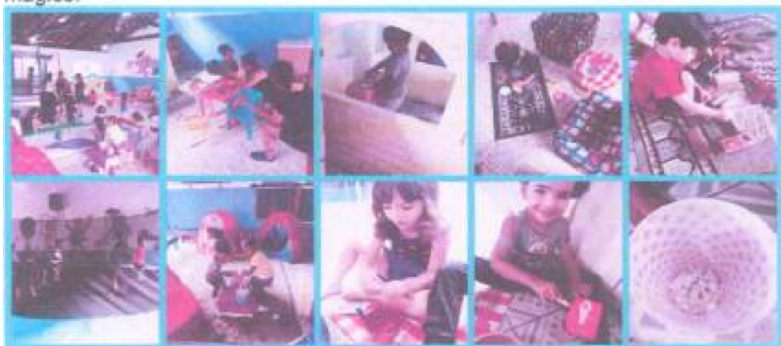
Pula-pula e muita diversão.