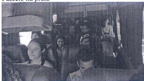
Passeio na praia