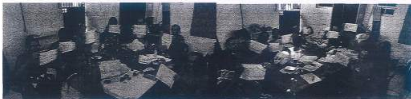
Grupo de mães.