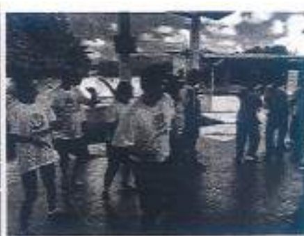
Aula de zumba e dança.