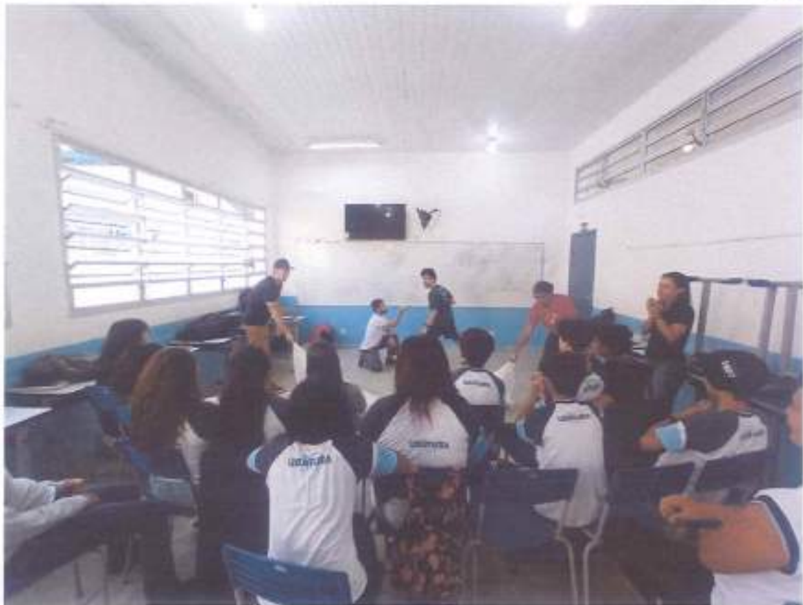
AÇÃO 5 - Oficinas para Crianças e Adolescentes da Bacia Hidrográfica de Itamambuca