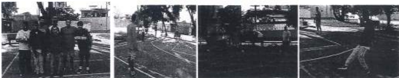
Treino Futsal trabalhado as habilidades, disciplina.