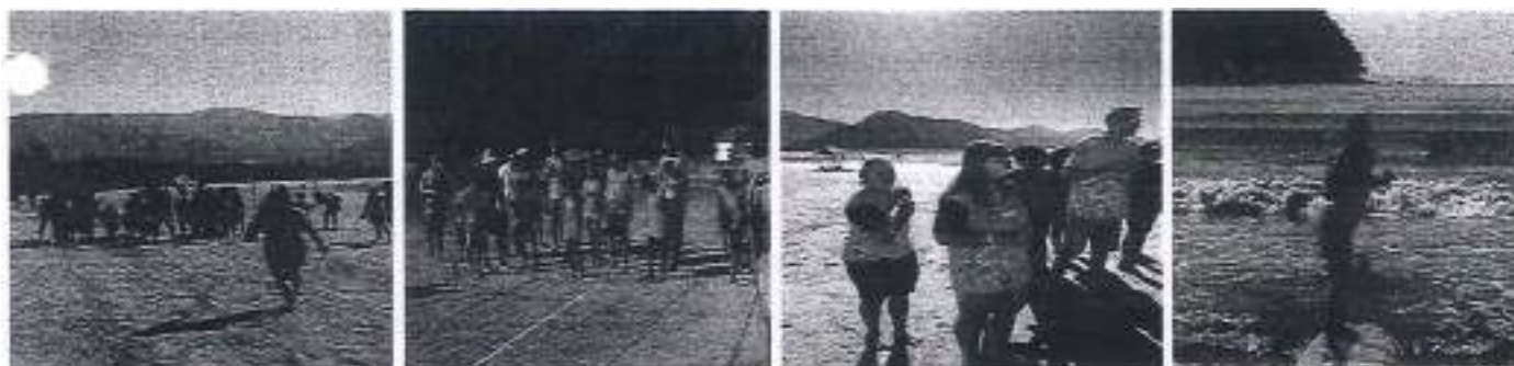
Participação no Paralimpico em Ubatuba na Praia do Pereque - Açu.