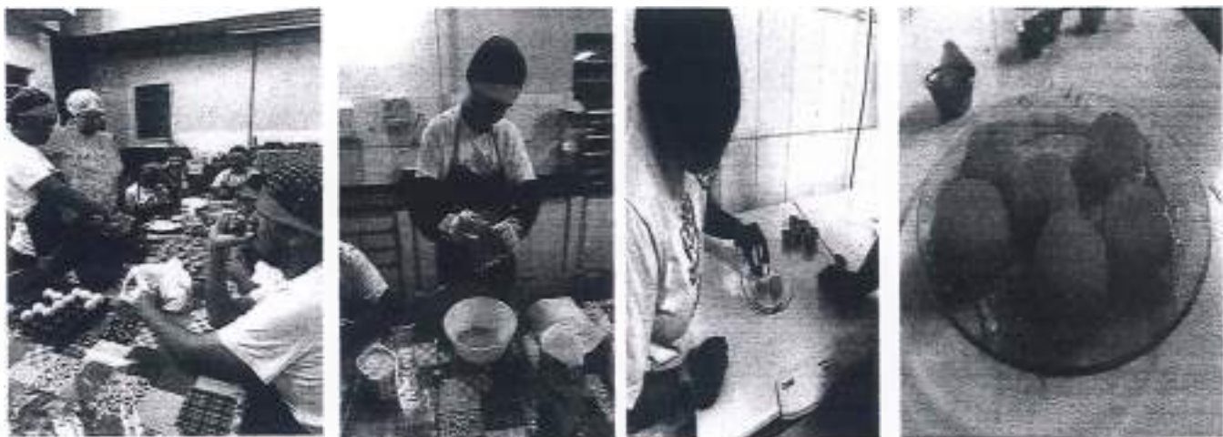
Projeto mão na Massa

Artesanato, pintura, recortes e colagens para dia de quem cuida de mim, desenvolvendo as habilidades e coordenação motora com materiais reciclados.