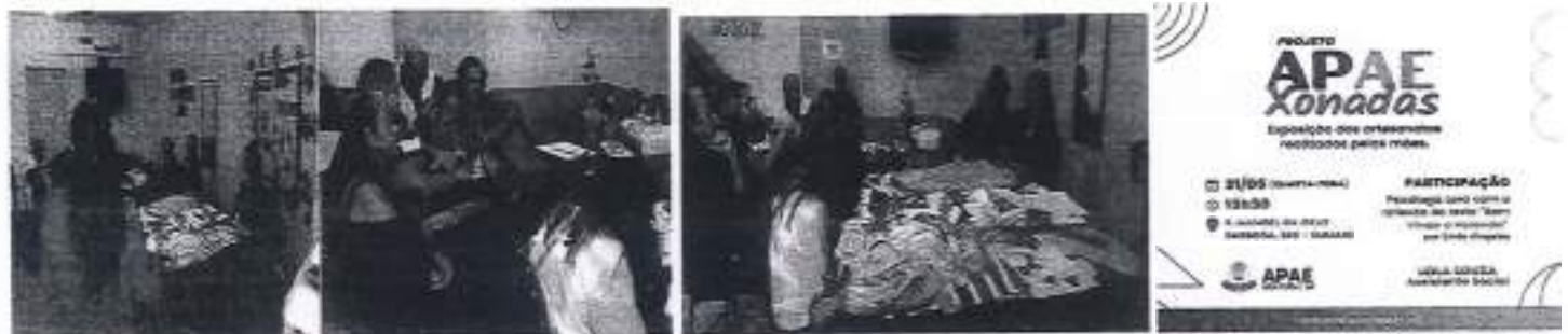
Projeto saúde e bem estar, grupo de maes.