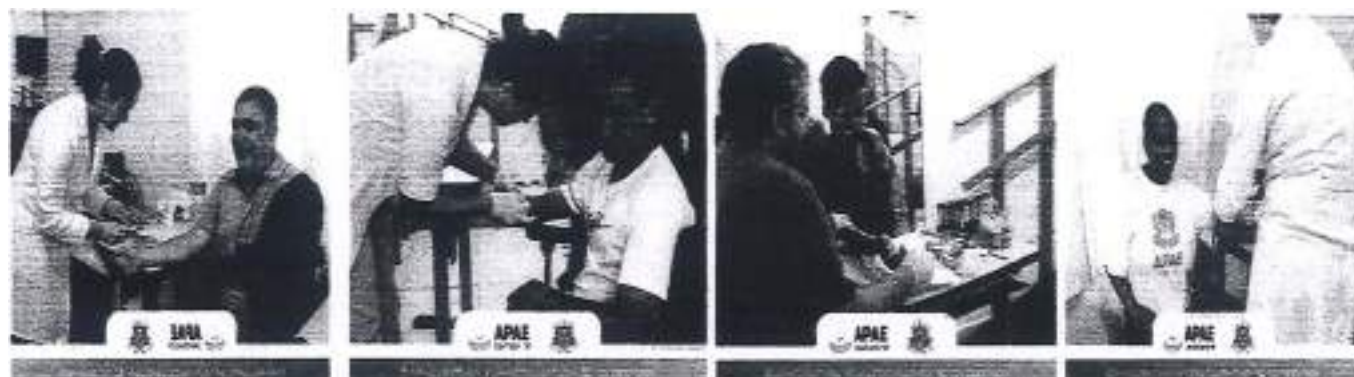
Mutirão coleta de Sangue com equipe da saúde parceria com a APAE.

Durante o mês de junho foram trabalhados em grupos de convivência, o trabalho social com os usuários e a participação nas oficinas de artesanato, dança, culinária projeto mãos na massa, os trabalhos com os usuários e com as famílias previne a ocorrência de situações de risco social e violações de direitos. A atuação é preventiva e proativa, pautada na defesa e na afirmação dos direitos e no desenvolvimento de capacidades e potencialidades. As ações realizadas têm como objetivo alcançar alternativas emancipatórias para o enfrentamento da vulnerabilidade social. Além disso, as atividades estão voltadas para a promoção do fortalecimento de vínculos familiares e comunitários, a autonomia, a independência, a segurança e o acesso aos direitos, tendo como consequência uma participação plena e efetiva na sociedade.