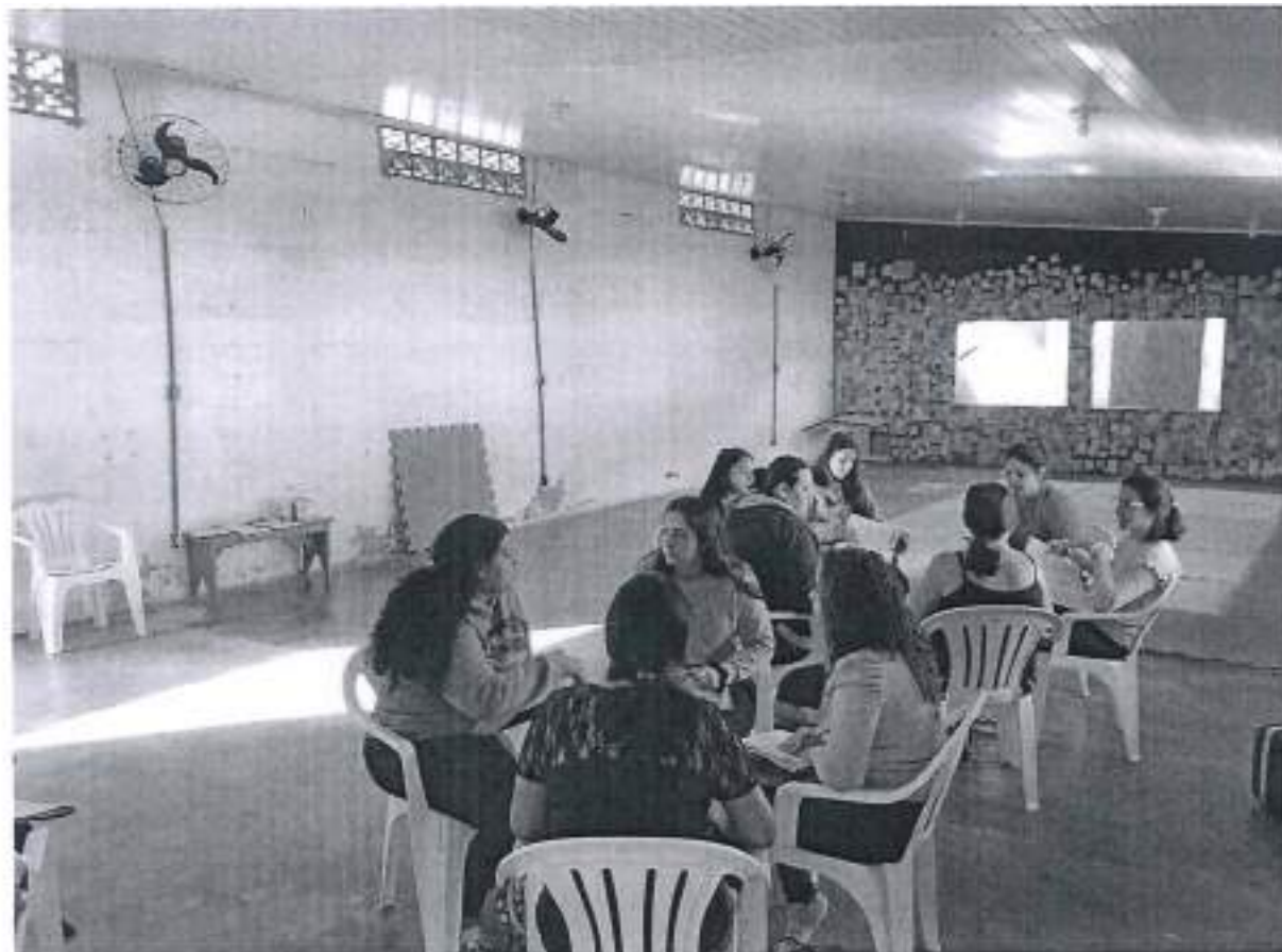
Anexo 2 - Fotos Cursos Práticos