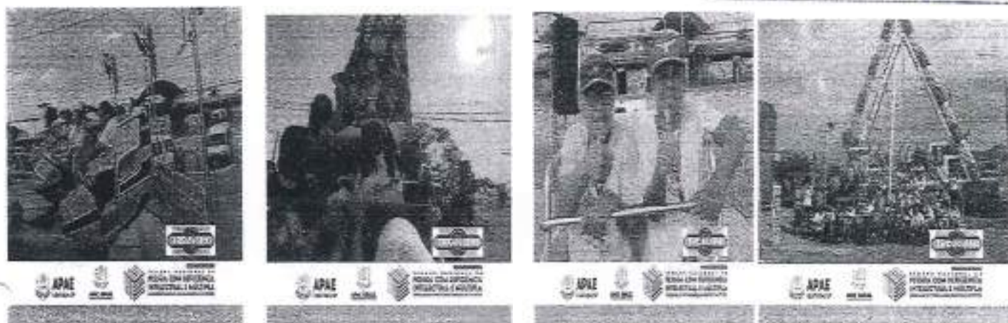
24/08/23 Diversão no Parque Trombine