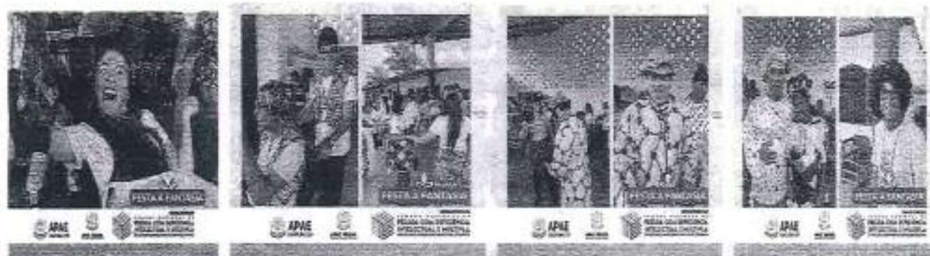
25/08/23 Baile festa a Fantasia