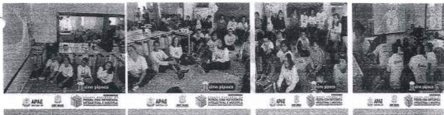
22/08 Cine Pipoca- Filme A Pequena Sereia