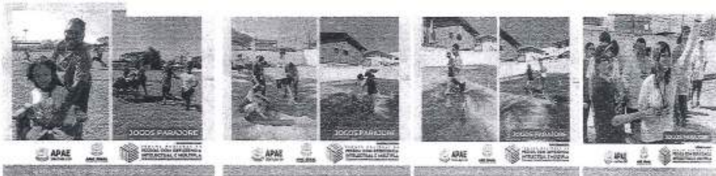
23/08 jogos Parajore

Associação de Pais e Amigos dos Excepcionais de Ubatuba CRCE – Certificado de Regularidade Cadastral de Entidades nº 2563 de 2012- CMDCA 001/1992 – COMAS Nº001/2004- Pró-Social Nº 4.703/92 Utilidade Pública Municipal Lei 1162 de 15/05/92. Utilidade Pública Estadual Decreto 46502/02. Utilidade Pública Federal Portaria 26/01 de 27 de abril de 2001.