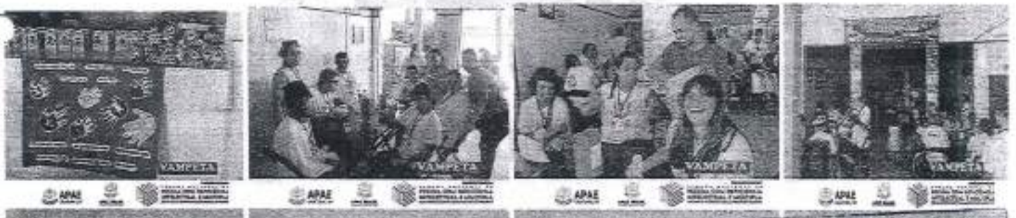
23/08 Passeio na Lanchonete do Vampeta. Facebook apae ubatuba