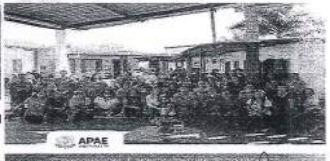
Palestra: Vencendo Barreiras e Preconceitos