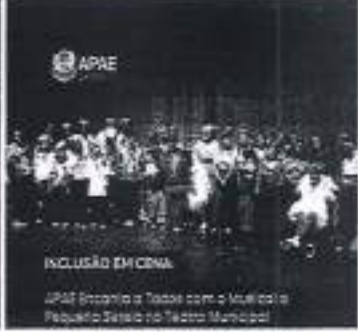
Apresentação no teatro municipal de Ubatuba com a Peça pequena sereia.