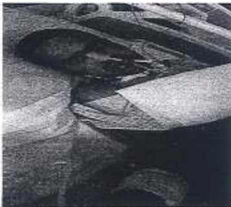
Visita ao usuário no Hospital Regional Caraguatatuba.