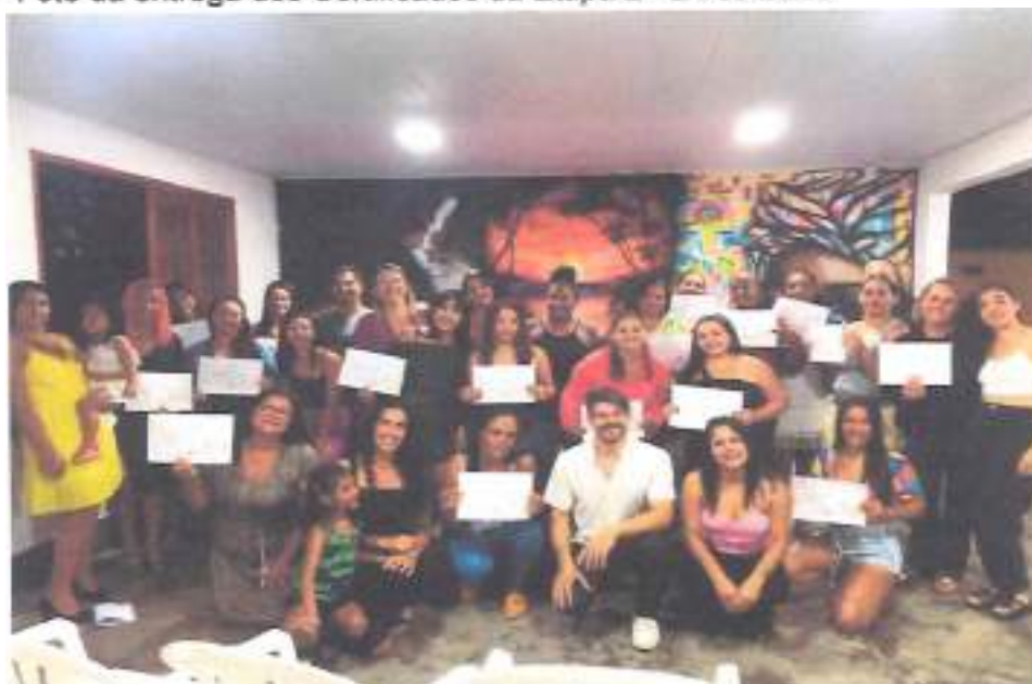
Anexo 1 - Foto da entrega dos Certificados da Etapa 2 - 21/09/2023