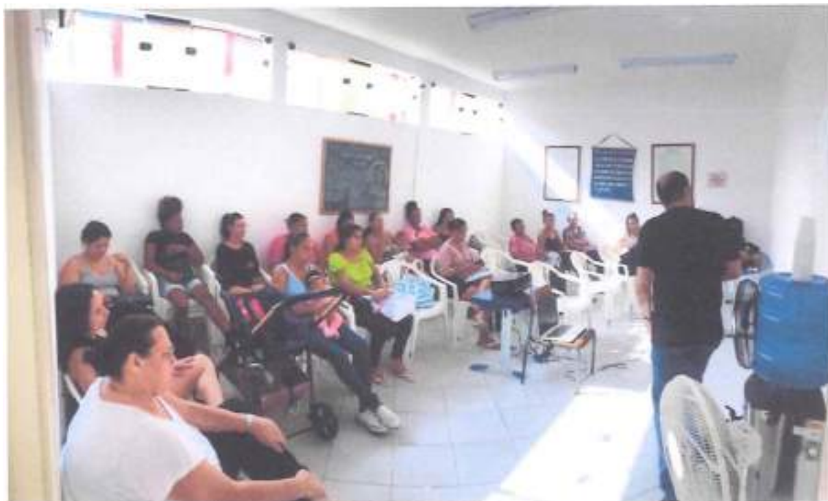
Anexo 2 - Foto das Aulas do SEBRAE - 25 à 29/09/2023