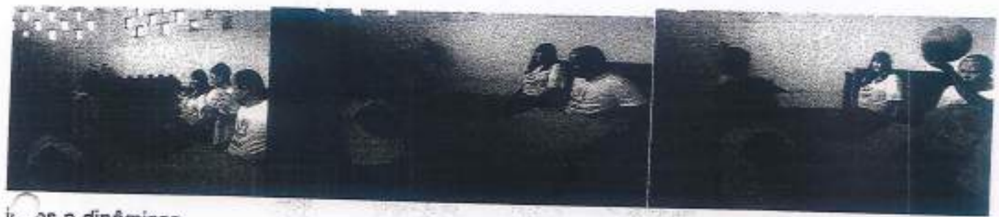
Jogos e dinâmicas