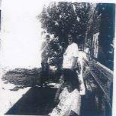
Jardinagem desenvolvendo a participação projeto Reutilizando.