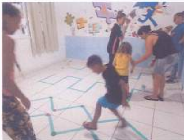
(Atividade prática circuito: Coordenação Motora - Socialização - Resposta de Comando)