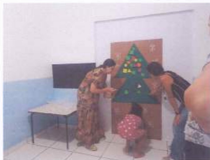
(Atividade prática circuito: Coordenação Motora - Socialização - Resposta de Comando)