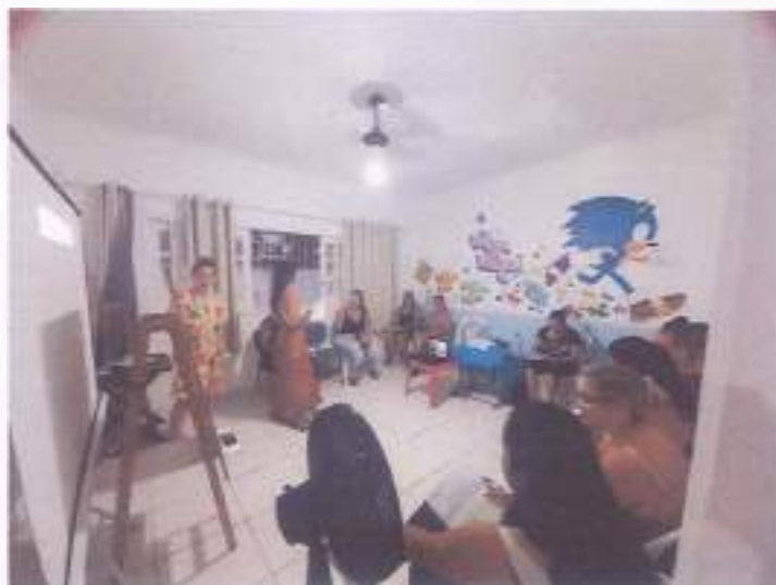
(Encontro 2 - 14/11/23 - Turma Infantil)