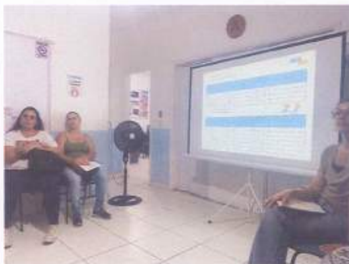
(Encontro 3 - 21/11/23 - Turma Infantil)