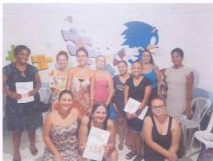
(Encontro 2 - 14/11/23 - Turma Infantil)