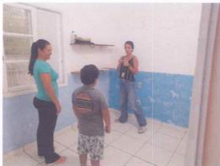
(Atividade prática circuito: Coordenação Motora - Socialização - Resposta de Comando)