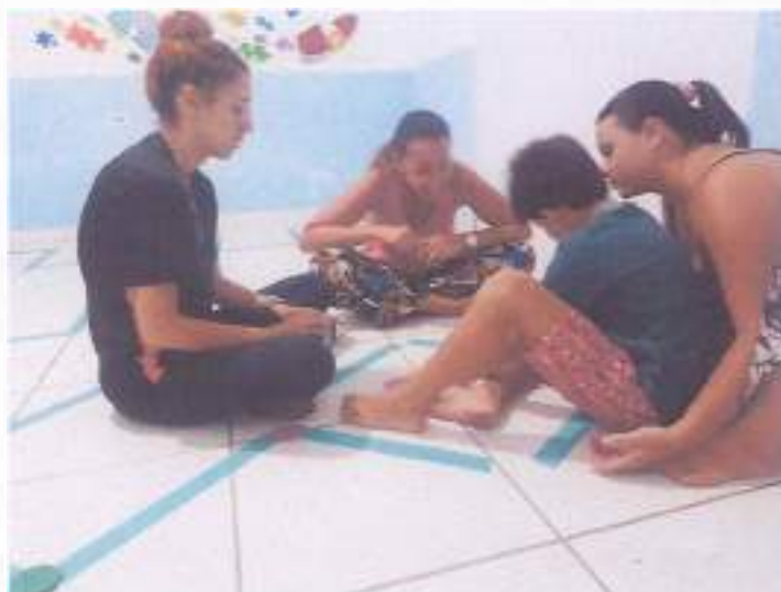
(Atividade prática circuito: Coordenação Motora - Socialização - Resposta de Comando)