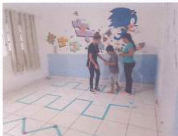
(Atividade prática circuito: Coordenação Motora - Socialização - Resposta de Comando)