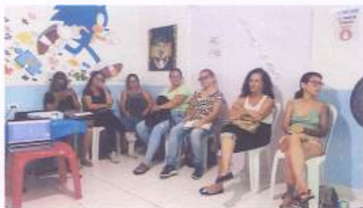
(Encontro 1 - 09/11/23 - Turma Juvenil)