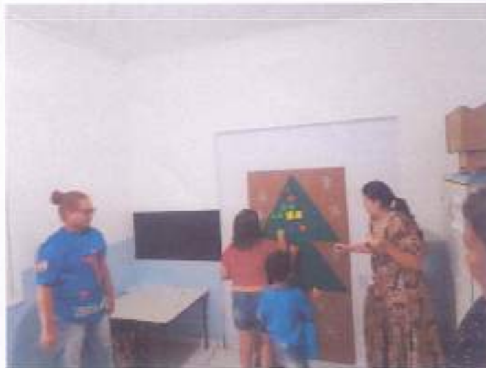
(Atividade prática Natalina: Coordenação Motora - Socialização - Resposta de Comando)