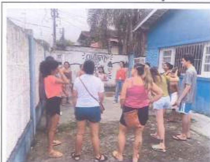
(Encontro com os adolescentes e seus familiares 30/11/2023)

*NOTA EXPLICATIVA: Em decorrência de uma burocracia do banco, não foi possível fazer uma quantidade de transferências e pagamentos na data prevista, ao chegar ao dia 31/10/2023, não foi possível efetuar o pagamentos de dois dos profissionais, o que ocasionou em dois pagamentos realizados no mesmo mês, entretanto o pagamento do dia 01/11/2023 refere-se a prestação de serviços do mês de Outubro.