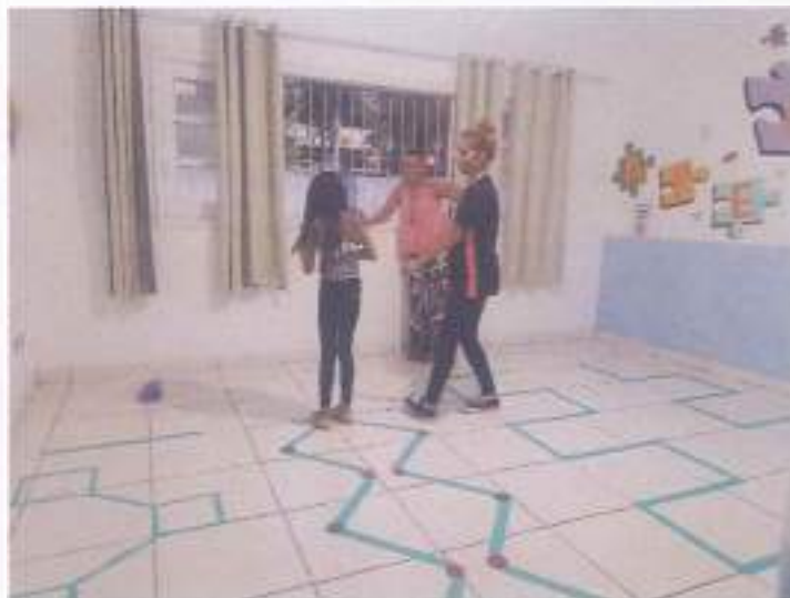
(Atividade prática circuito: Coordenação Motora - Socialização - Resposta de Comando)