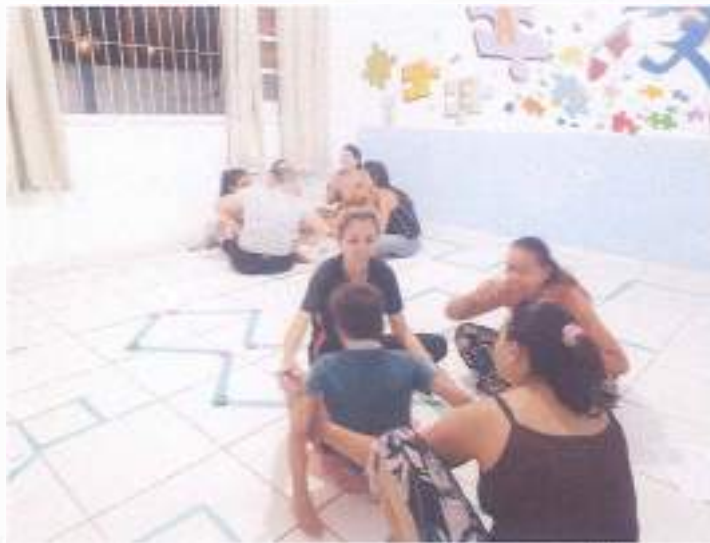
(Atividade prática circuito: Coordenação Motora - Socialização - Resposta de Comando)