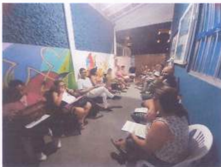
(Encontro 2 - 13/11/23 - Turma Juvenil)