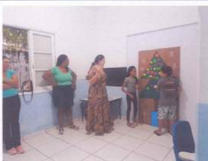
(Atividade prática circuito: Coordenação Motora - Socialização - Resposta de Comando)