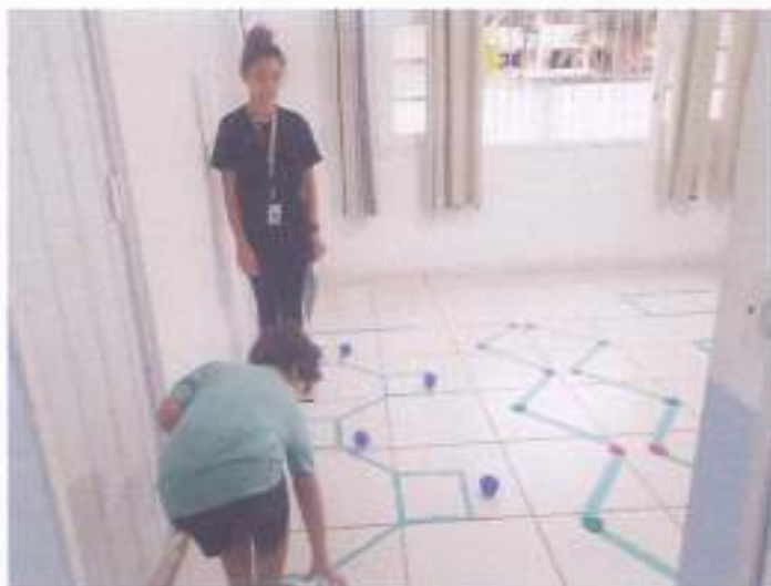
(Atividade prática circuito: Coordenação Motora - Socialização - Resposta de Comando)