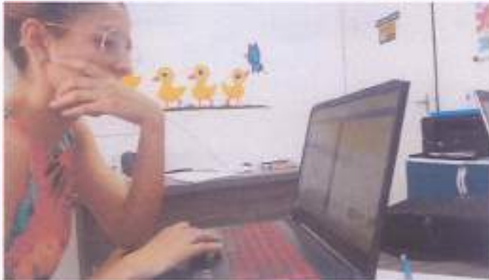
(Produção das apostilas)