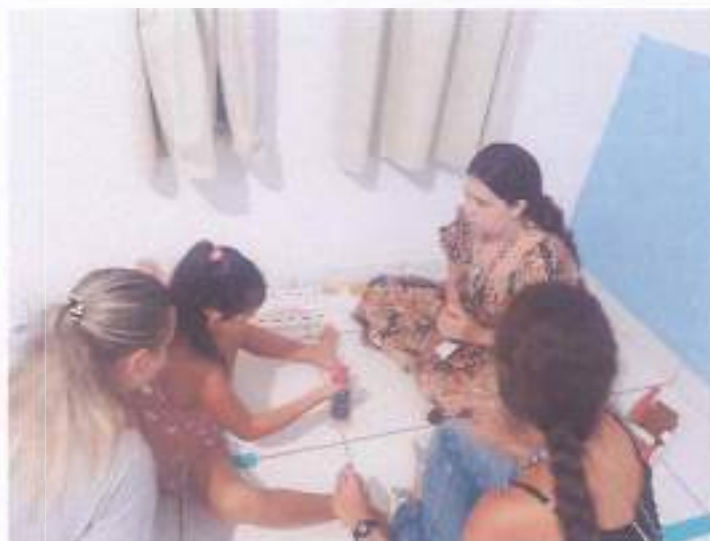
(Atividade prática circuito: Coordenação Motora - Socialização - Resposta de Comando)