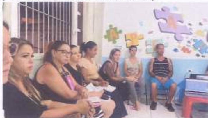
(Encontro 1 - 09/11/23 - Turma Juvenil)