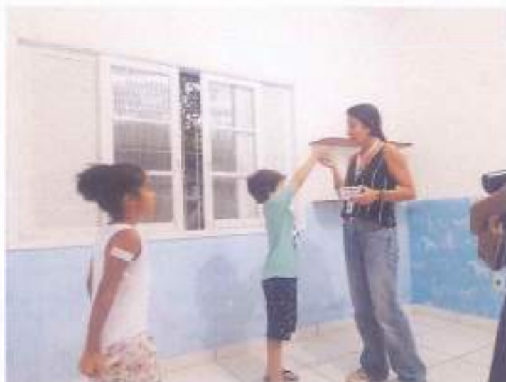
(Atividade prática circuito: Coordenação Motora - Socialização - Resposta de Comando)