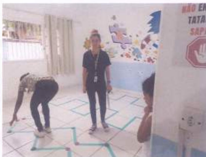
(Atividade prática circuito: Coordenação Motora - Socialização - Resposta de Comando)