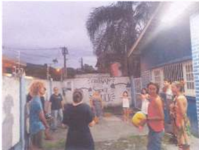
(Encontro com os adolescentes e seus familiares 30/11/2023)