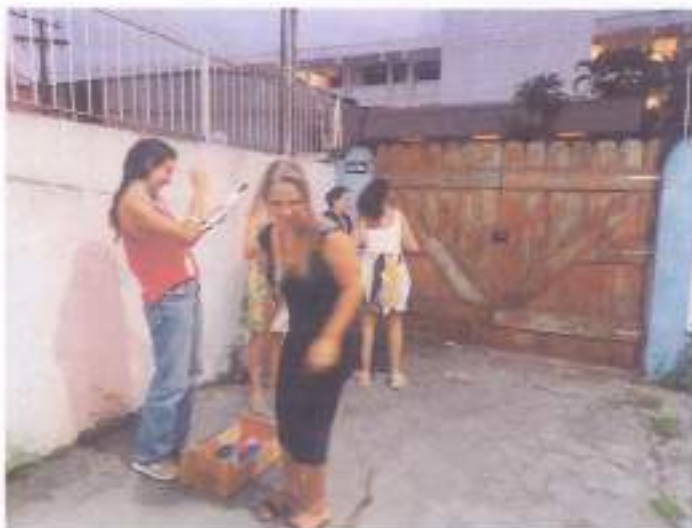
(Jogo de preferências com os adolescentes e seus familiares 30/11/2023)

Atividades de interação e socialização com os adolescentes entre si e entre seus responsáveis.