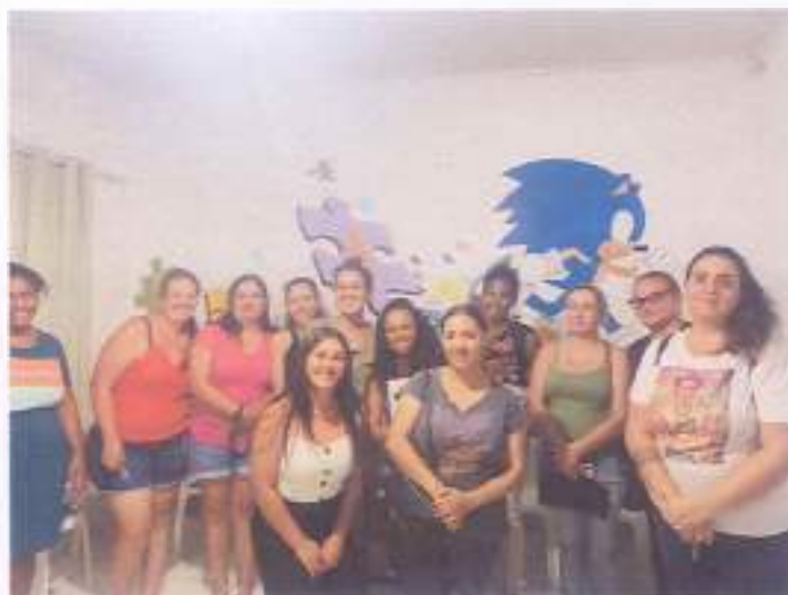
(Encontro 1 - 07/11/23 - Turma Infantil)

Foram realizados 03 encontros em cada uma das turmas.