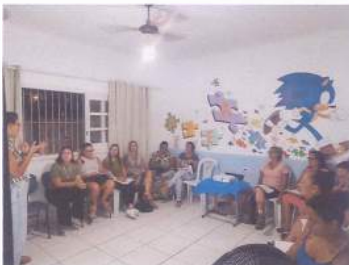
(Encontro 3 - 23/11/23 - Turma Juvenil)