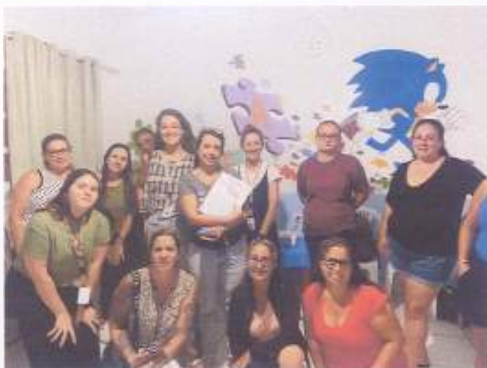
(Encontro 3 - 23/11/23 - Turma Juvenil)