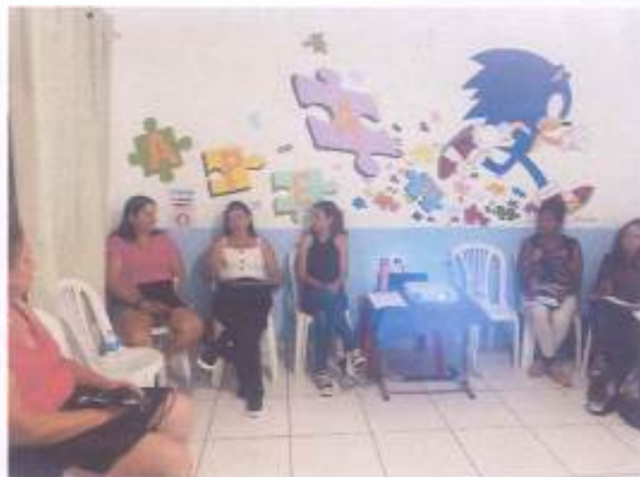
(Encontro 1 - 07/11/23 - Turma Infantil)