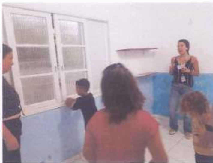
(Atividade prática circuito: Coordenação Motora - Socialização - Resposta de Comando)