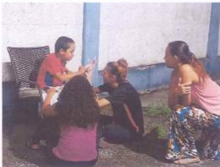
(Atividade prática circuito: Coordenação Motora - Socialização - Resposta de Comando)