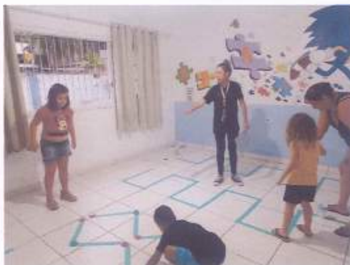
(Atividade prática circuito: Coordenação Motora - Socialização - Resposta de Comando)