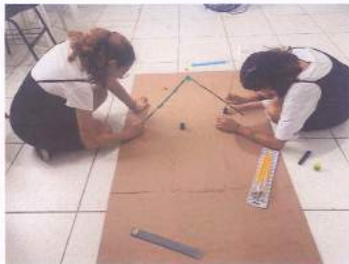
(Montagem das salas e circuitos)

Montamos 03 salas que contavam com circuitos e atividades de aproximação e estimulação entre as crianças e as responsáveis/cuidadoras.