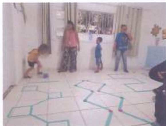
(Atividade prática circuito: Coordenação Motora - Socialização - Resposta de Comando)