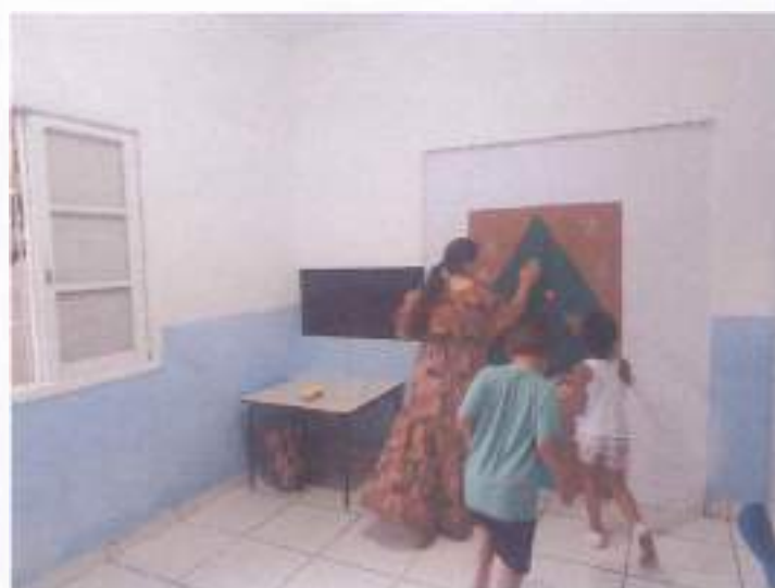
(Atividade prática circuito: Coordenação Motora - Socialização - Resposta de Comando)