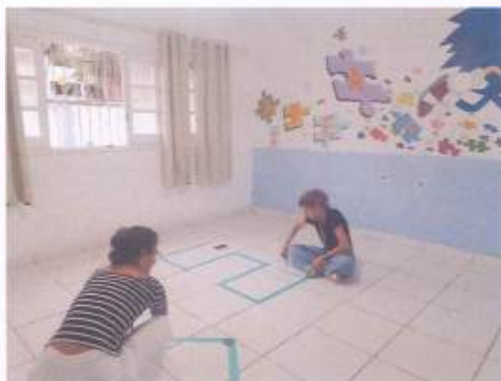
(Montagem das salas e circuitos)