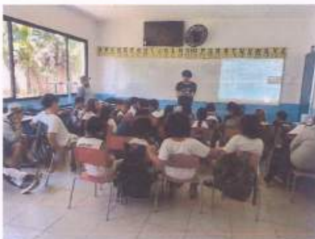
Reunião 13, 09/11, 6ºB