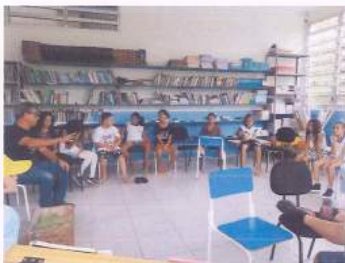
Oficina Biblioteca, 30/11, 4ªA, escola Belarmino