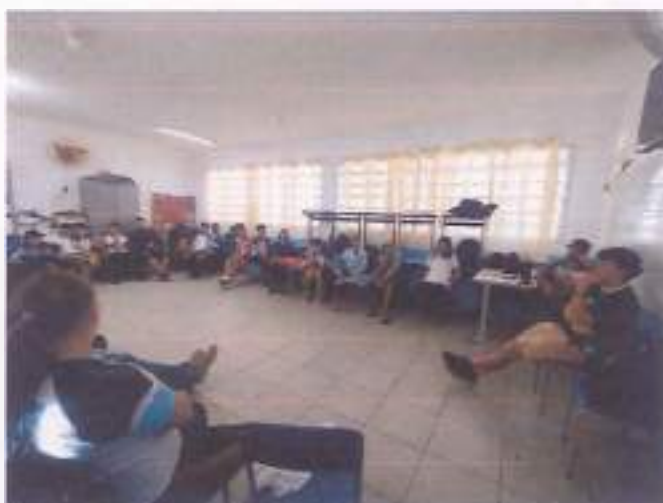
Reunião 13, 07/11, 7ºA