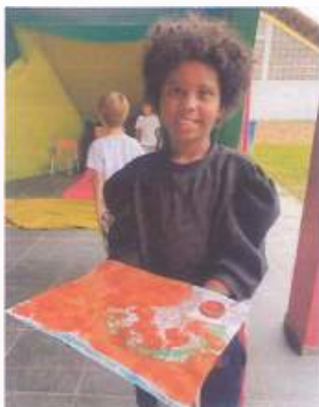
Oficina de Histórias, 01/11, 2ºB, escola Honor