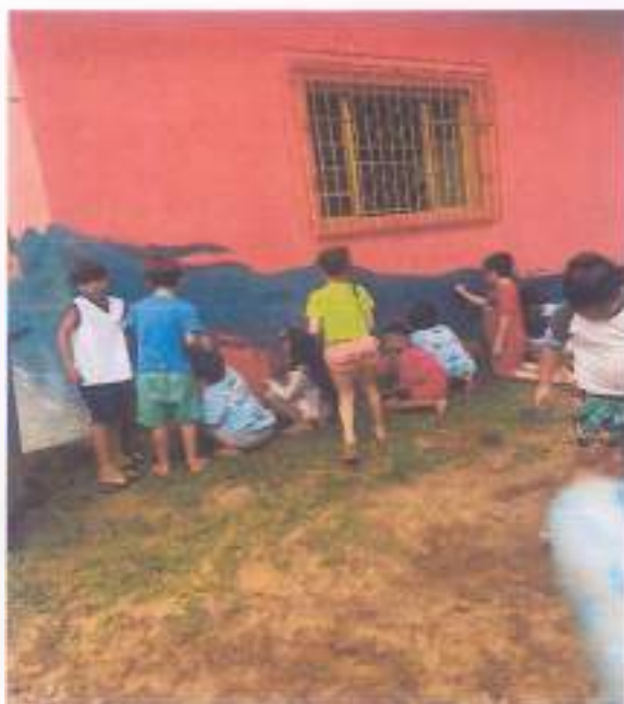
Oficina História, 29/11, 2ªA, escola Honor