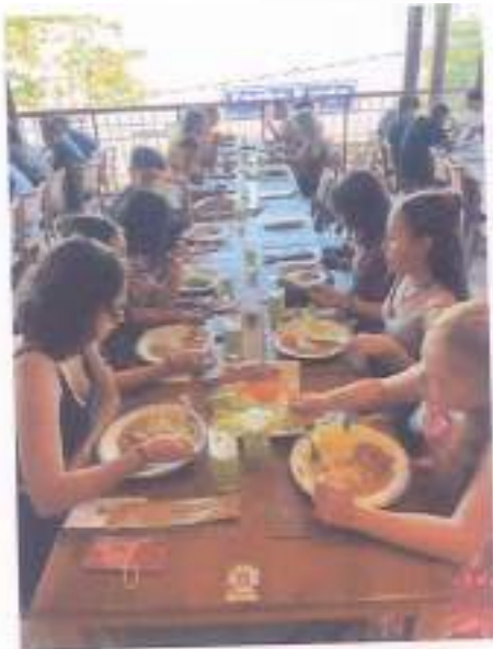
Saída de pesquisa Aldeia e câmara