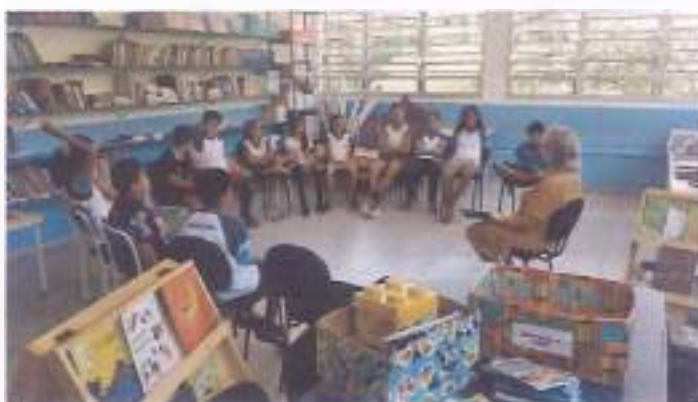
Oficina Biblioteca, 09/11, 4º ano, escola Belarmino