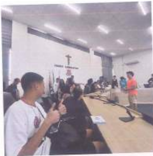
Saída de pesquisa Aldeia e câmara