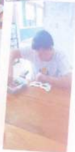
A importância da família em nossas vidas