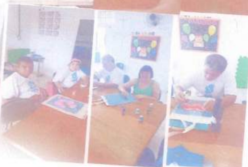
Artes na sacola.