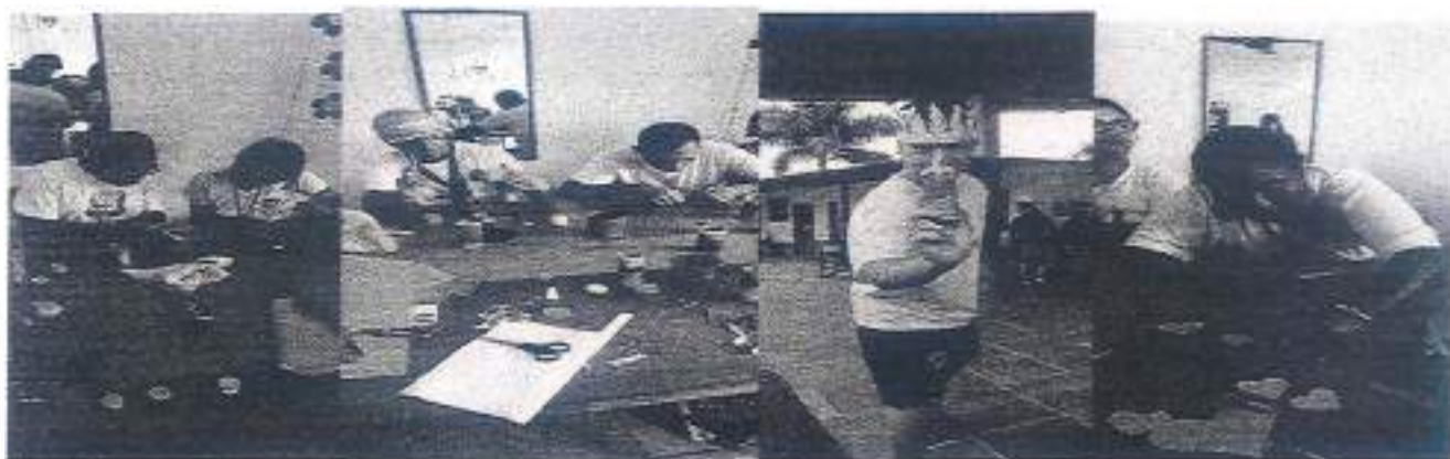
1-oficina de artesanatos

Nesse mês foram realizadas receitas simples onde os atendidos puderam trabalhar em grupo com receitas simples como, gelatinas, salada de frutas, brigadeiro de leite em pó, antes de iniciar a oficina é apresentado a receita onde trabalhamos peso, medidas e os ingredientes, após finalizarmos as receitas os atendidos podem comer e o restante é vendido para equipe, com o valor é usado para manter a própria oficina.