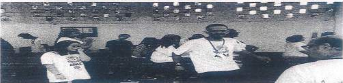
Oficina de Dança