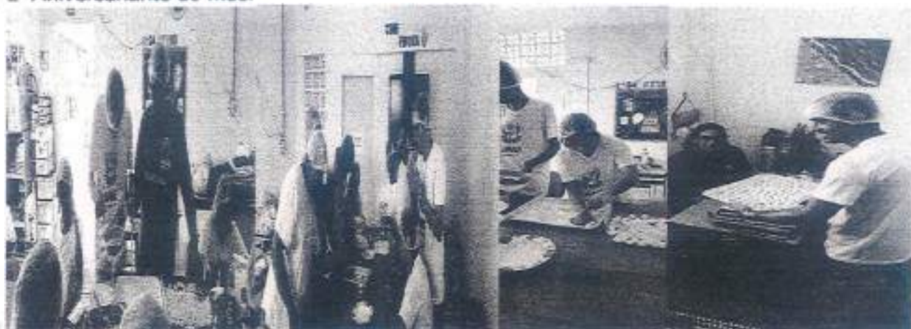
Projeto mãos na massa (oficina de culinária)