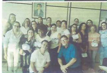
TREINAMENTO DE EQUIPE

Sociedade de São Vicente de Paulo – Lar Vicentino de Ubatuba