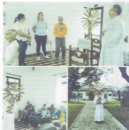
RESPLENDOR DIVINO ESPIRITO SANTO