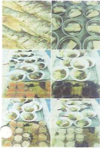
PARTE DO CARDÁPIO

Gestão da atual diretoria 29/01/2023 a 28/01/2025