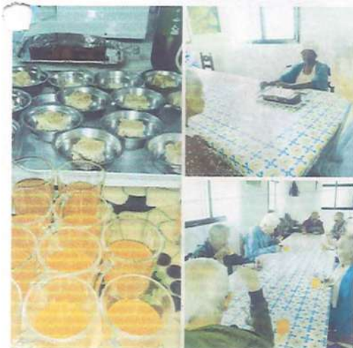
ANIVERSARIANTE DO MÊS