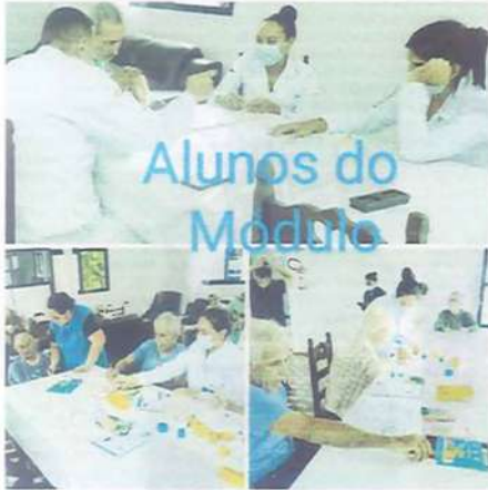
Alunos do Módulo

Gestão da atual diretoria 29/01/2023 a 28/01/2025