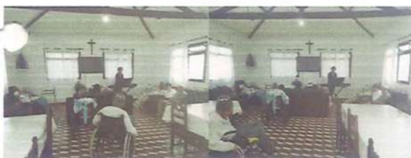
MUSICALIZAÇÃO – FUNDART