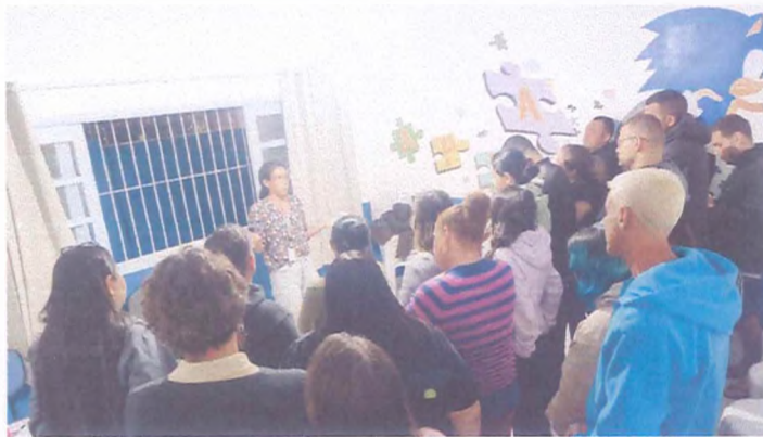
(Encontro de prática com a família e rede de apoio - Turma Infantil - 30/07/2024)

Esse envolvimento coletivo fortalece o vínculo familiar, busca reduzir o estresse e promove um ambiente mais funcional e acolhedor, contribuindo para o bem-estar de todos os envolvidos.