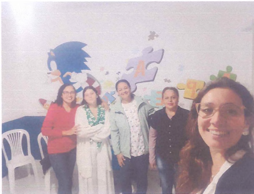
(Encontro Responsáveis Turma Juvenil - 25/07/24)