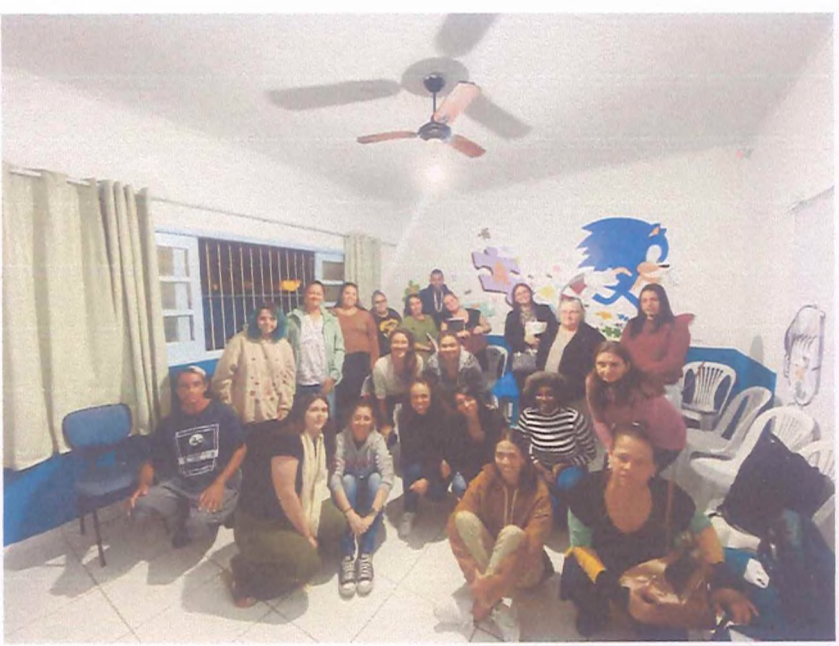
(2º Encontro Responsáveis Turma Infantil - 16/07/24)

* No encontro do dia 11/07 haviam duas participantes que estavam afastados por questões de saúde e nos informaram que não poderiam participar presencialmente, propusemos que acompanhassem o Orientar de forma remota.