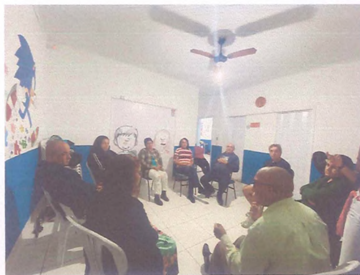
(Encontro de prática com a família e rede de apoio - Turma Juvenil - 18/07/2024)

A participação de todos os membros da família promove um entendimento mais profundo das necessidades e desafios diários enfrentados pelas crianças e adolescentes, permitindo uma abordagem mais coordenada e empática. Além disso, a escuta da rede de apoio desempenha um papel importante para os (as) cuidadores.