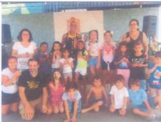
Reunião CRAS Oeste