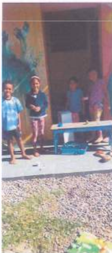
Período da Tarde