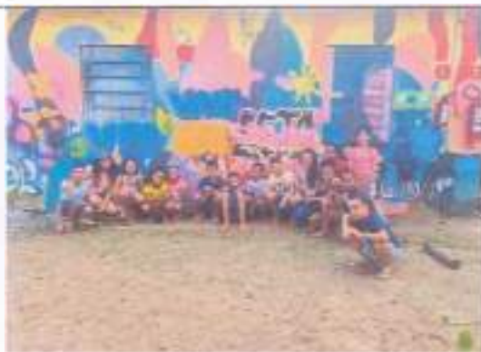
Passeio Projeto Tamar