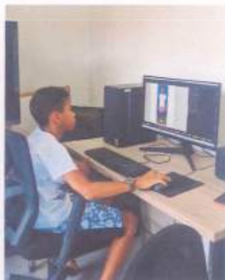
Customização e musicalização