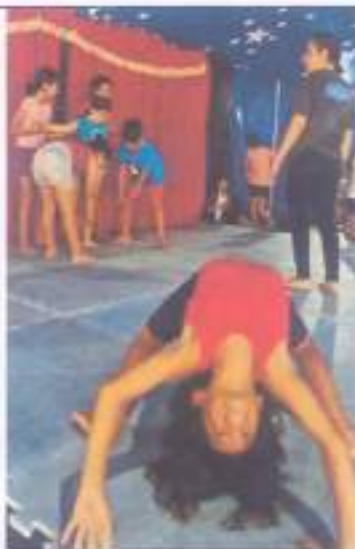
Artes do Movimento