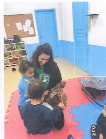
Crianças conhecendo as tartarugas marinhas a partir da apresentação de peças biológicas e pelúcias.