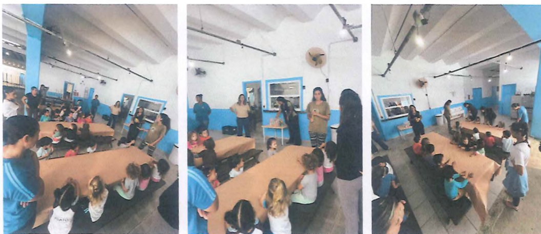
Distribuição de tintas, pincéis e organização de crianças para a atividade de pintura livre e carimbo de mãos.