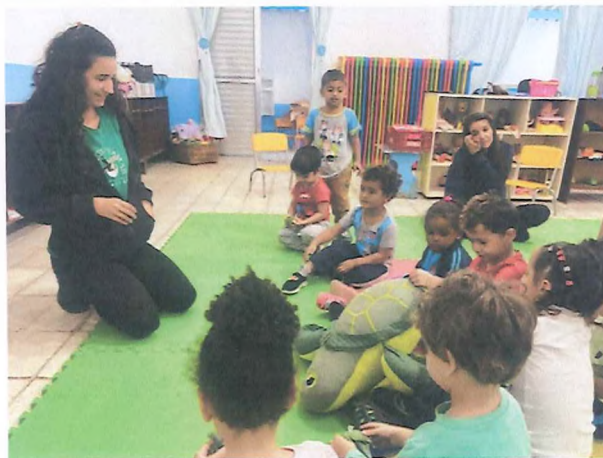
Demonstração sobre postura de ovos utilizando pelúcia.