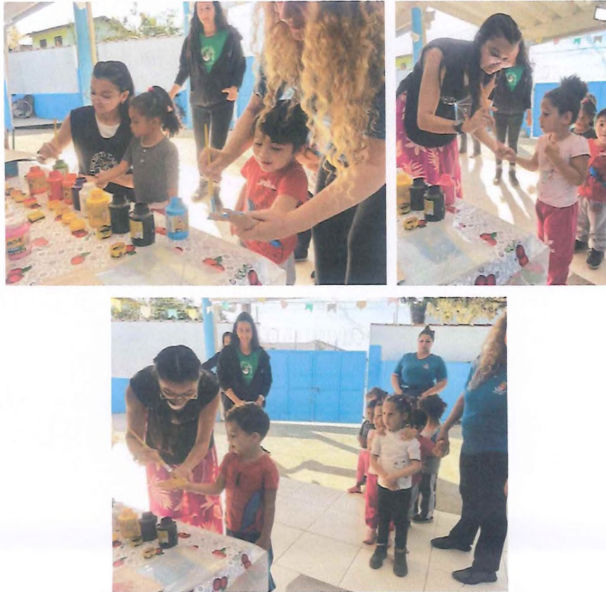
Pintura das mãozinhas das crianças para realização do carimbo na parede