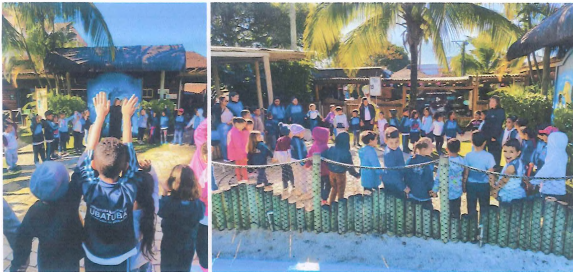
Brincadeira sobre o nascimento das tartarugas