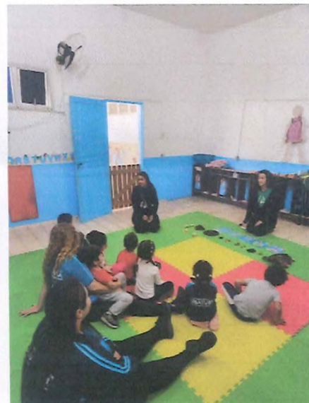
Explicação sobre as tartarugas marinhas com réplicas, imagens e peças biológicas.