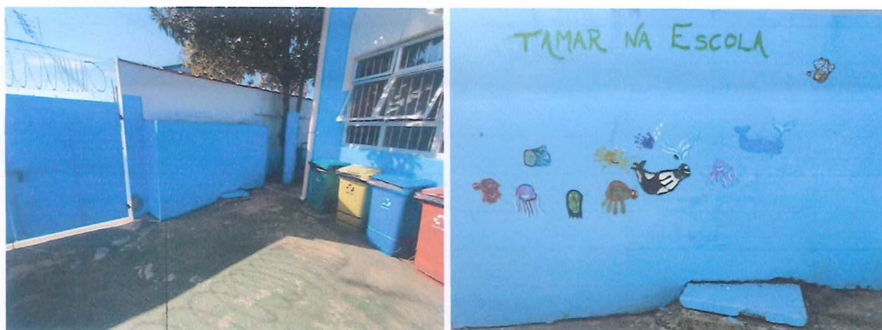
Parede escolhida pela coordenação da escola e contorno de carimbos para finalizar animais marinhos.