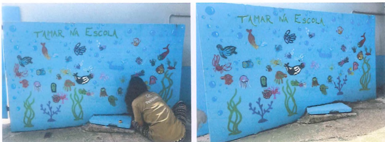
Contorno de carimbos para finalização dos animais marinhos e construção do painel.