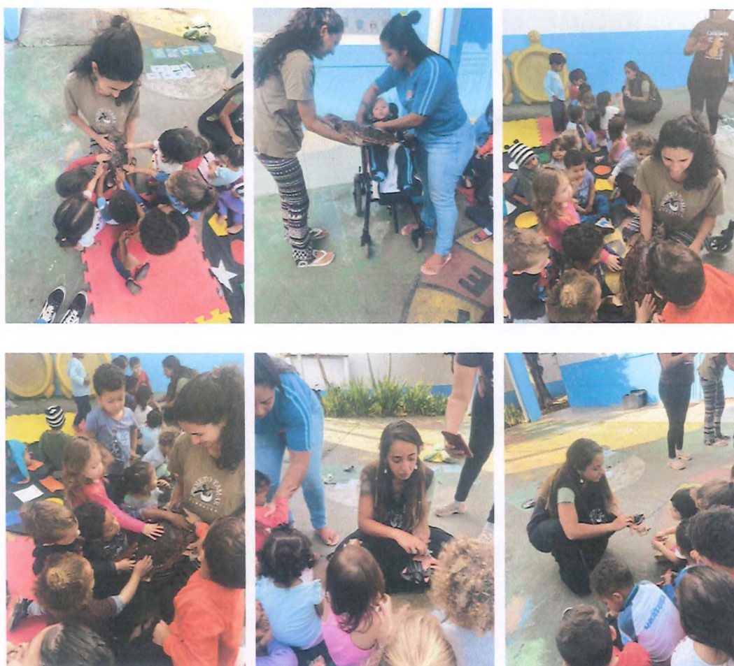
Contato dos alunos com peças biológicas e replicas das espécies de tartarugas marinhas.