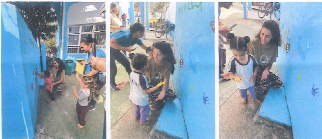
Carimbo na parede