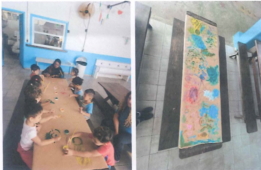
Início da pintura, pincéis entregues aos alunos para pintura livre e carimbo de mãos.