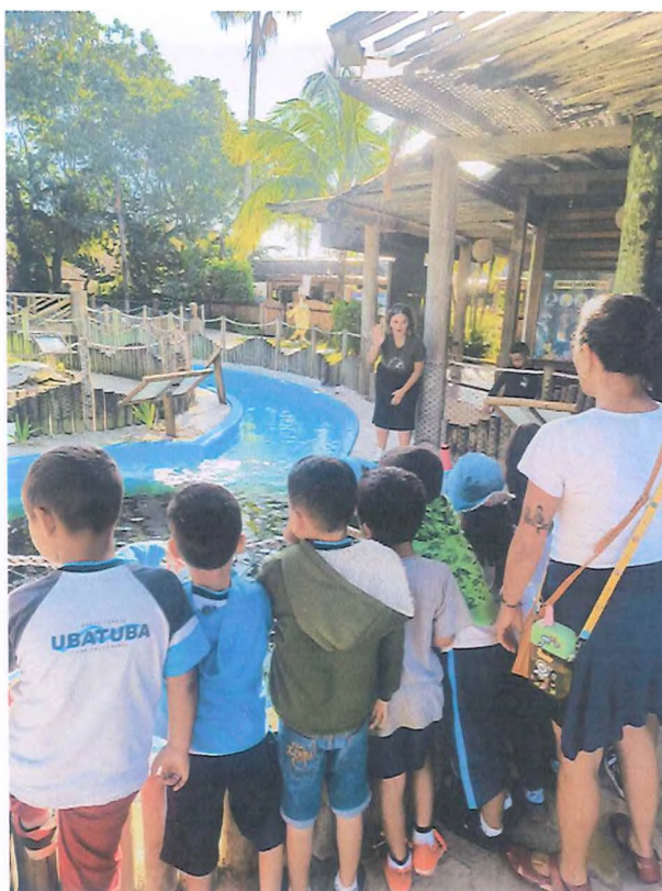
Atendimento de escola municipal no Centro de Visitantes