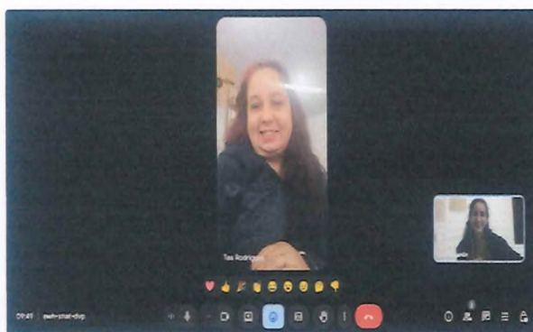
Reunião com E.M.E.I. Prof a Maria Alice Leite da Silva