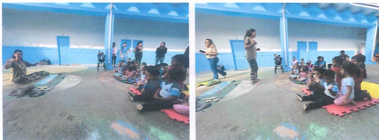
Momento de música infantil.