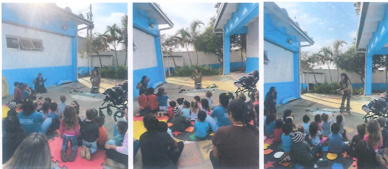
Conversa com as crianças sobre os animais marinhos e espécies de tartarugas.