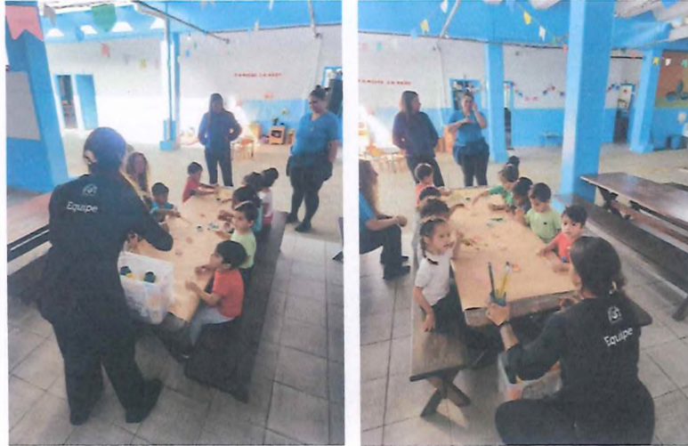
Distribuição de tintas e organização de crianças para a atividade.