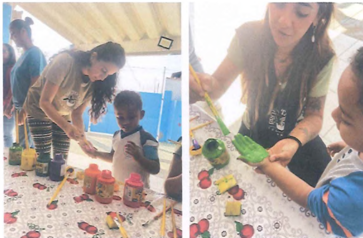
Pintura das mãozinhas das crianças