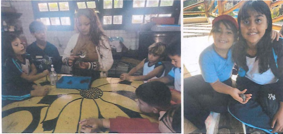
Apresentação dos filhotes das cinco espécies de tartarugas