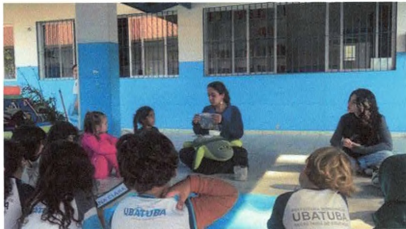
Contação de história com a tartaruga de pelúcia e lixo retirado do estômago de tartaruga.