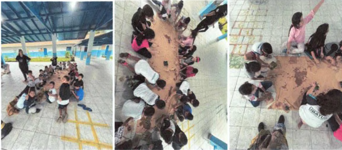
Oficina artística com elementos da natureza.