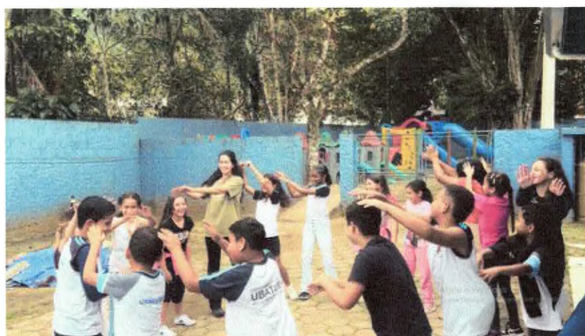
Brincadeira "Iapo, ia ia ê".