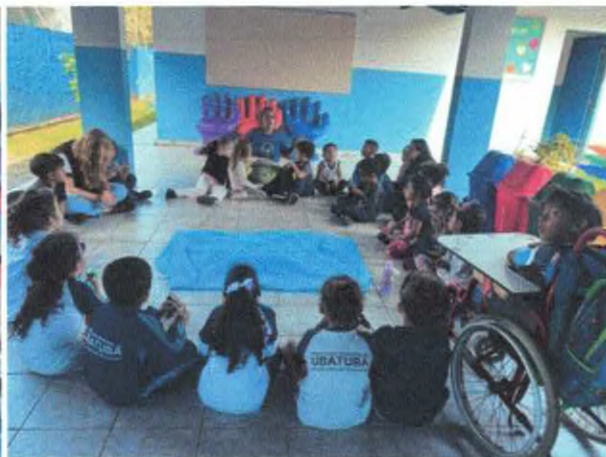
Contação de história com a tartaruga de pelúcia e lixo retirado do estômago de tartaruga.