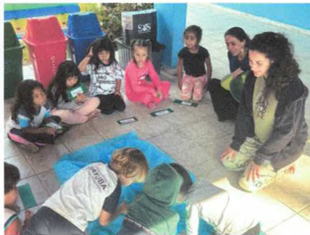
Atividade “o que tem nesse oceano”