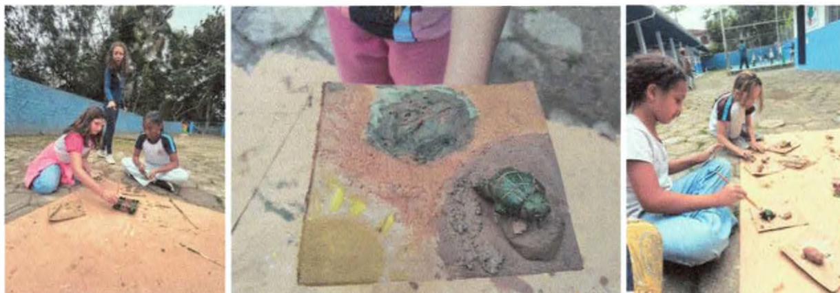
Oficina artística com elementos da natureza.