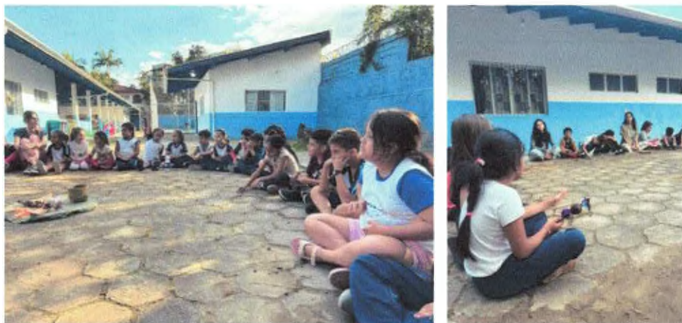
Roda de conversa com objetos de comunidades tradicionais e contação de história.