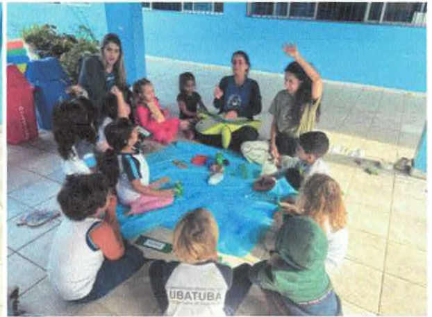
Descoberta de resíduos e criação de história do caminho do lixo.