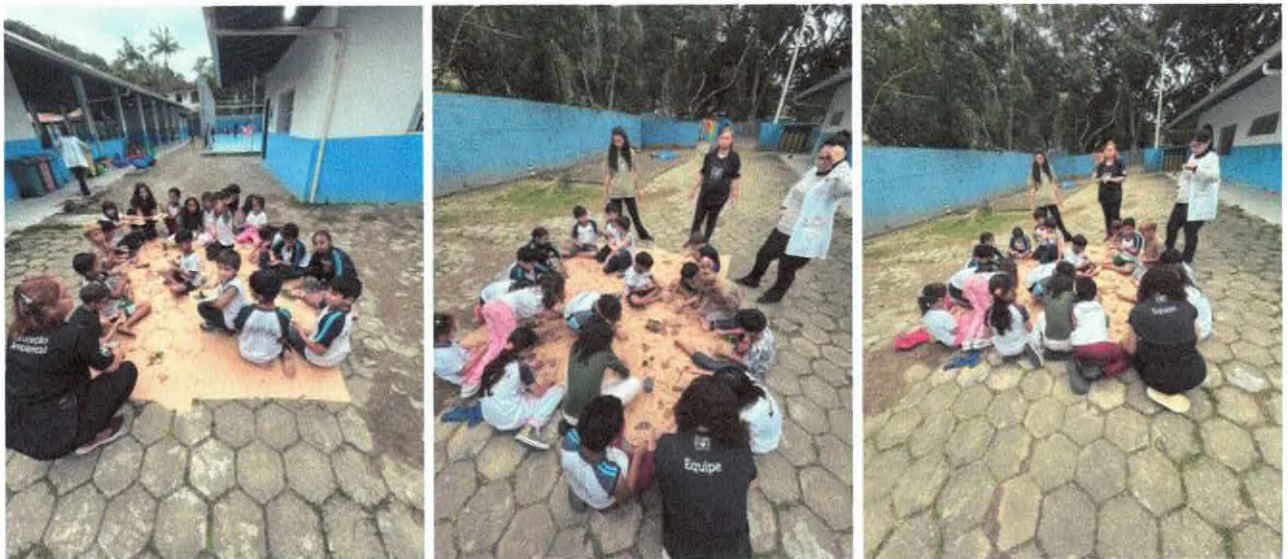
Oficina artística com elementos da natureza.