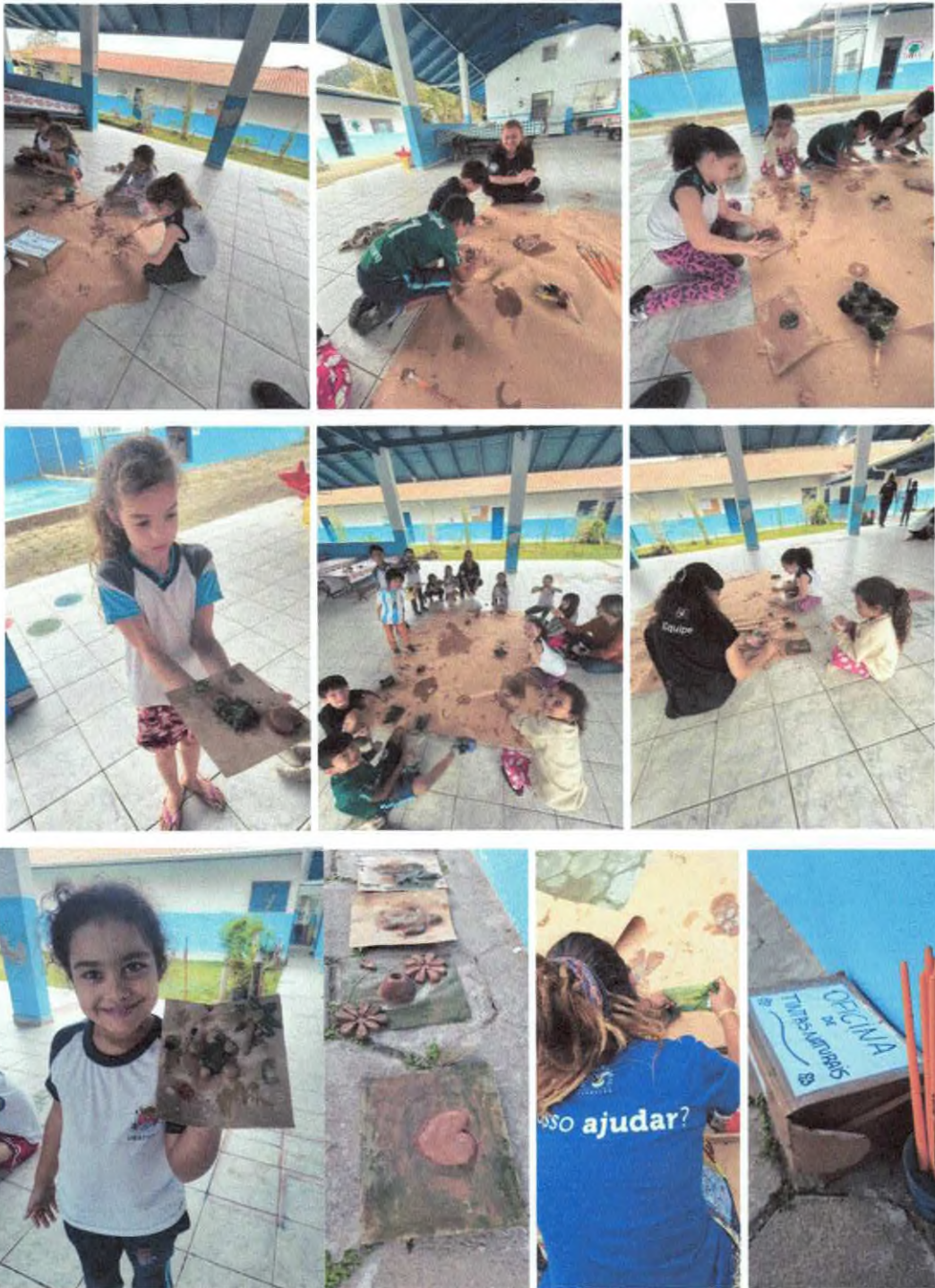
Oficina artística com elementos da natureza.

Fundação Projeto Tamar / Secretaria Municipal de Educação / PMU