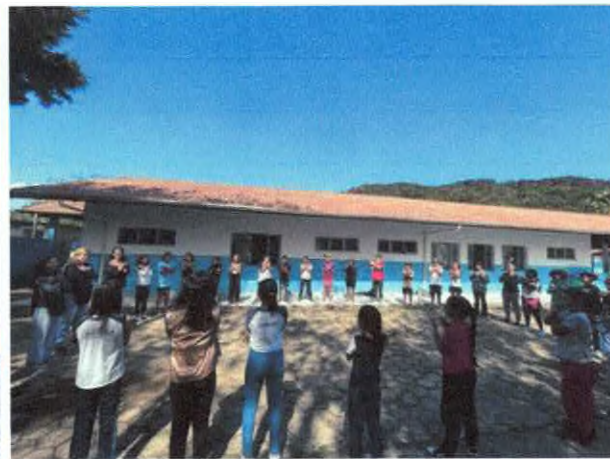
Brincadeira de dança de indígena "Iapo, ia ia ê".