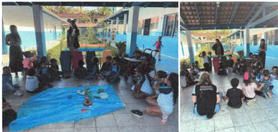
Descarte correto dos resíduos recicláveis.