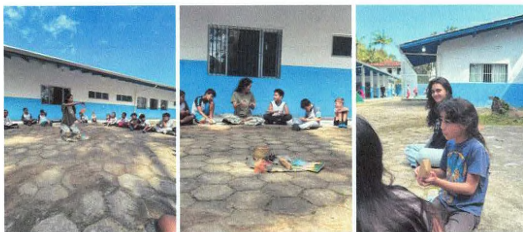
Roda de conversa com objetos de comunidades tradicionais.