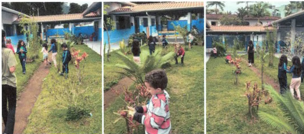
Brincadeira da Alimentação das espécies de tartarugas marinhas.