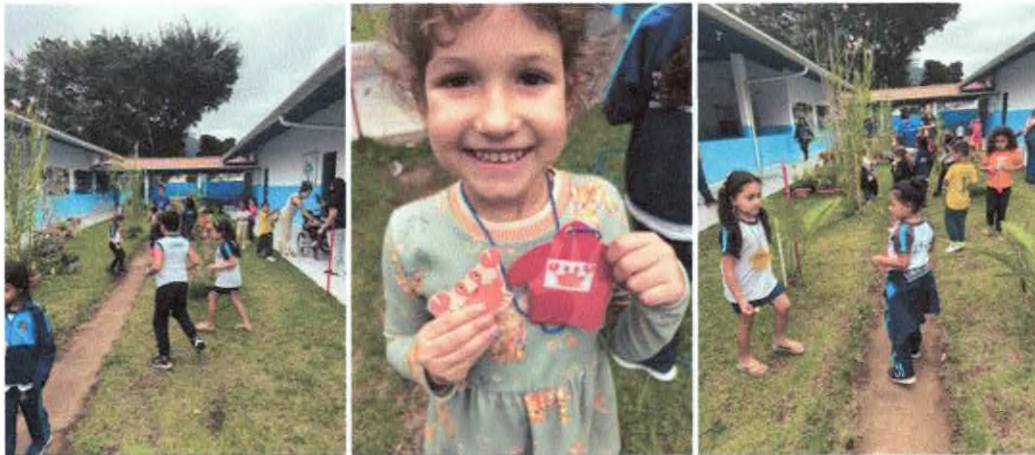
Brincadeira da Alimentação das espécies de tartarugas marinhas.