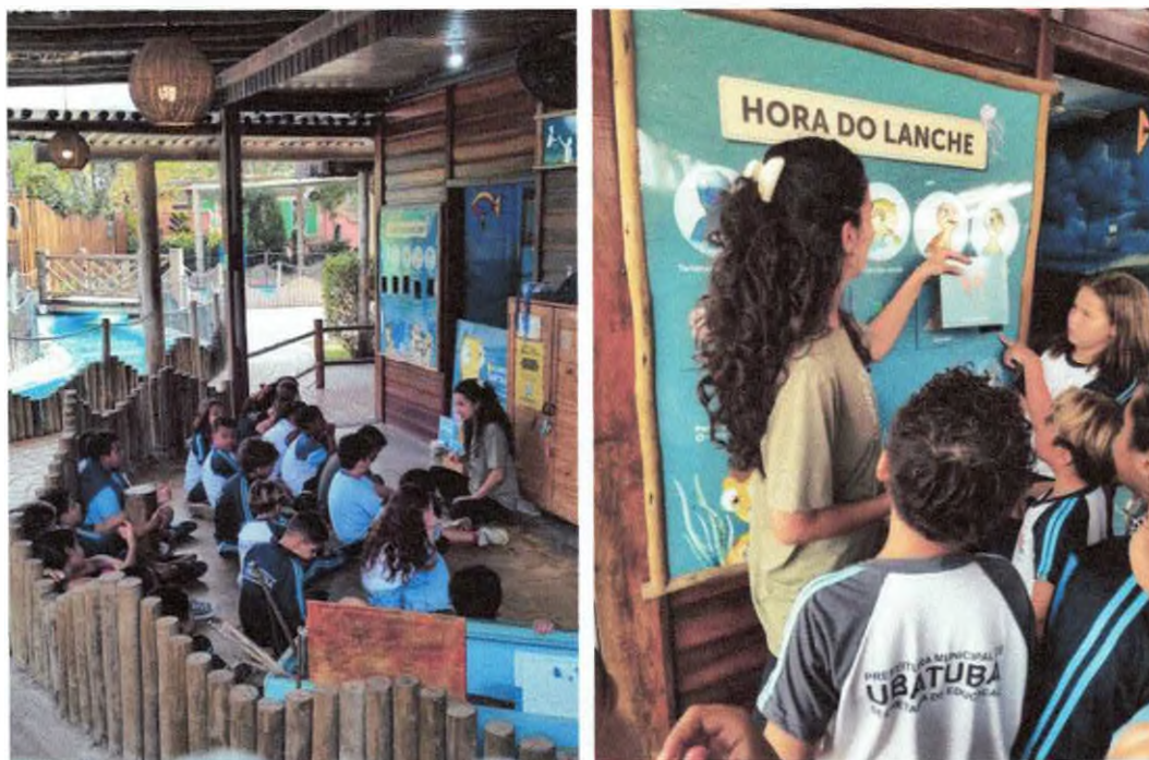
Conversa sobre o impacto do lixo sobre as tartarugas

No segundo momento as crianças participaram da brincadeira sobre alimentação das tartarugas (descrita nas páginas 14 e 15), e para finalizar, fizeram uma oficina artística com a intenção de produzir algo que remeta a conexão das crianças com a natureza, e trazer para a prática um pouco do que aprendemos com os 5 R's sendo alguns deles o de repensar e reduzir o consumo. Para isso utilizando apenas elementos naturais, como folhas, galhos, argila e tintas naturais a base de espirulina, pó de beterraba, cúrcuma, urucum e pó de carvão.