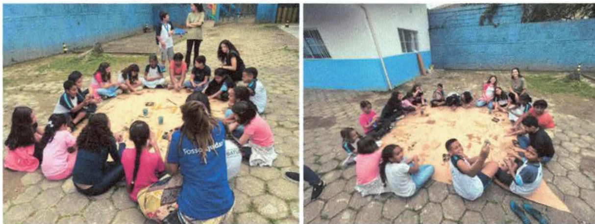
Oficina artística com elementos da natureza.

Fundação Projeto Tamar / Secretaria Municipal de Educação / PMU