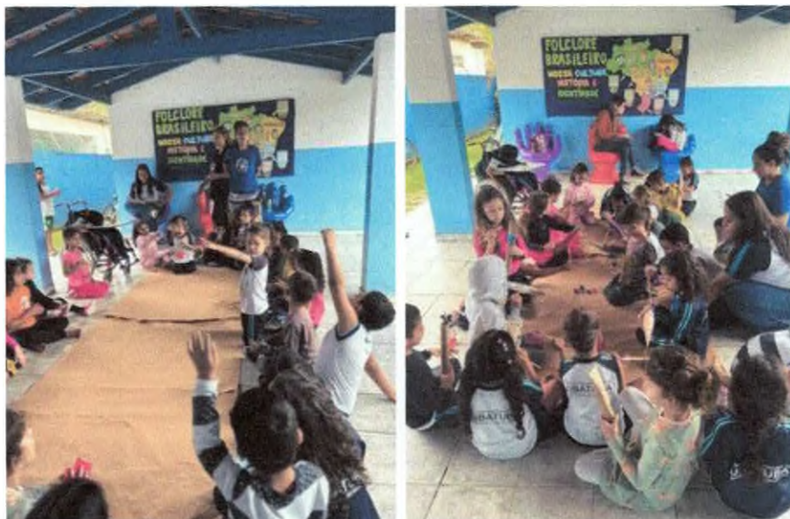
Oficina artística de produção de instrumento musical com materiais recicláveis.