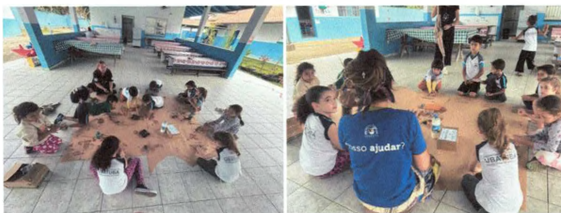
Oficina artística com elementos da natureza.