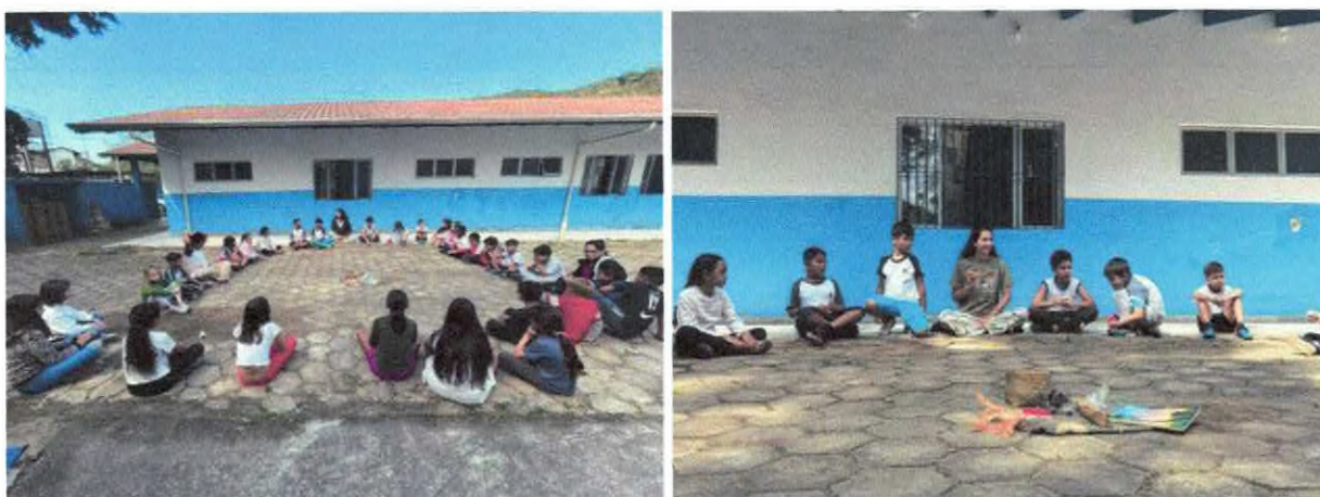
Roda de conversa com objetos de comunidades tradicionais.