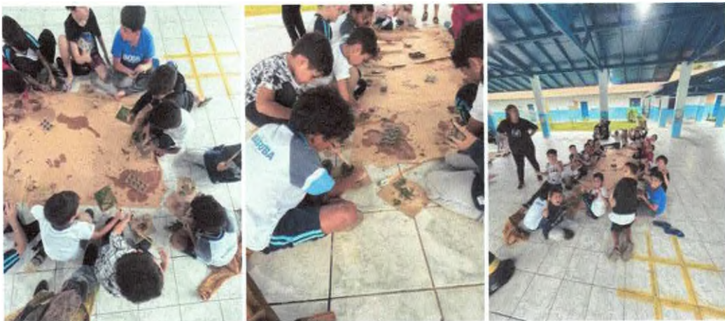
Oficina artística com elementos da natureza.