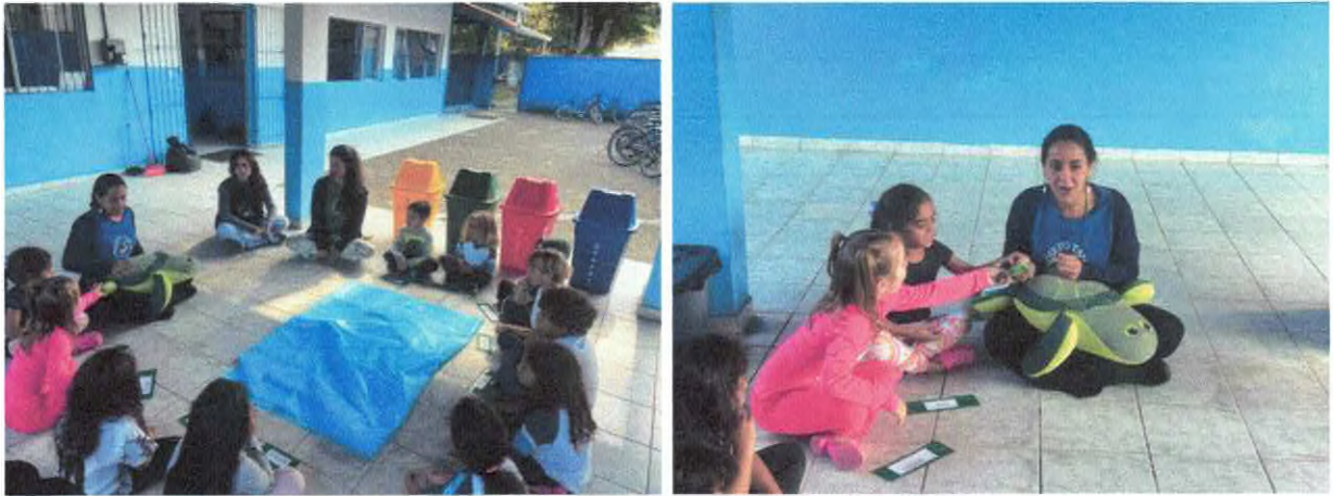
Contação de história com a tartaruga de pelúcia