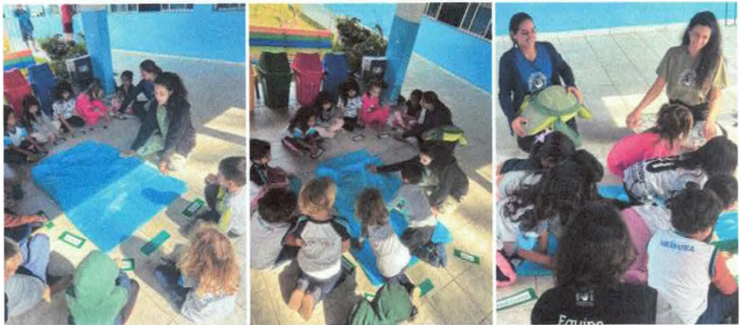
Atividade “o que tem nesse oceano”