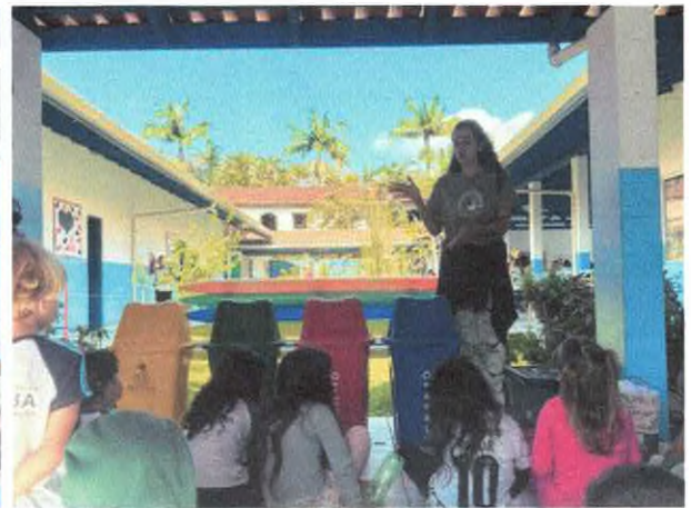
Conversa sobre 5 R's e apresentação das lixeiras