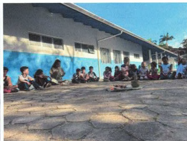
Roda de conversa com objetos de comunidades tradicionais e contação de história.