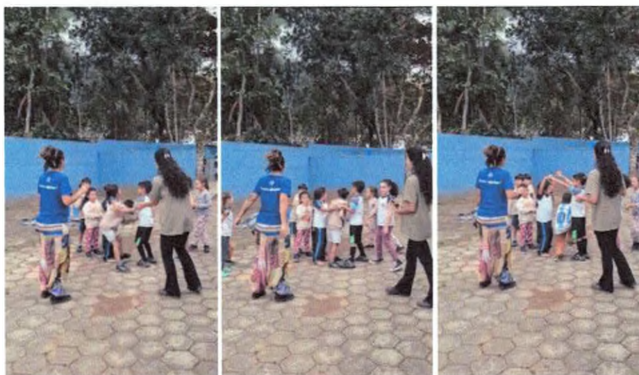
Brincadeira "Bom barquinho".