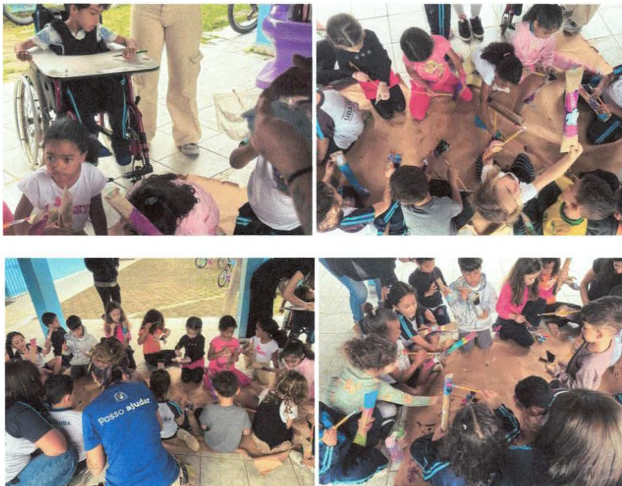
Oficina artística de produção de instrumento musical com materiais recicláveis.