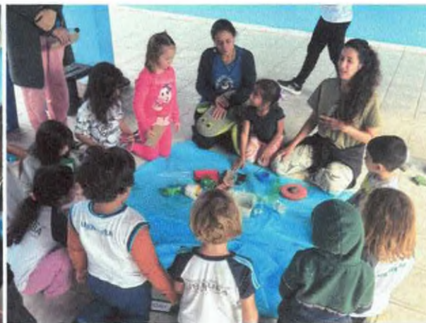
Descoberta de resíduos e criação de história do caminho do lixo.