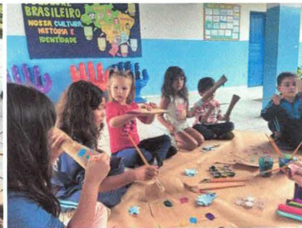
Produção de instrumento musical com materiais recicláveis.