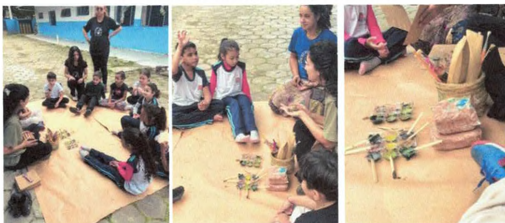
Oficina artística com elementos da natureza.