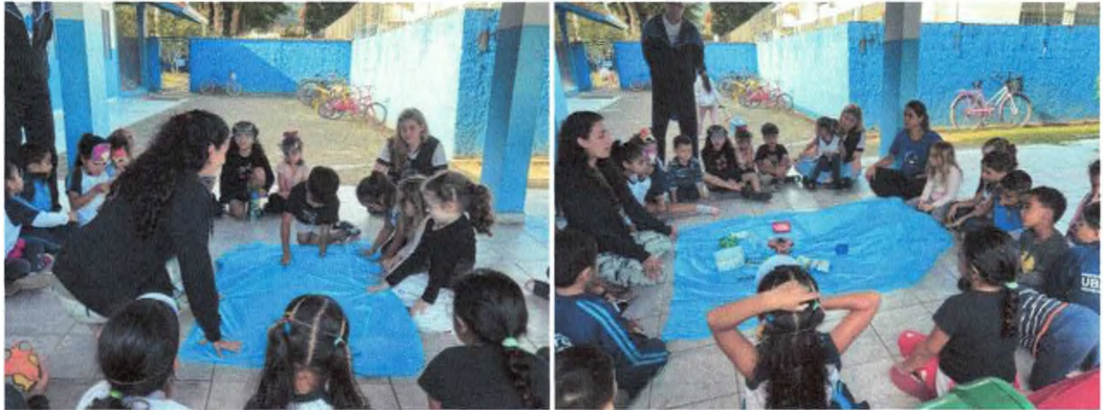
Descoberta de resíduos e criação de história do caminho do lixo.