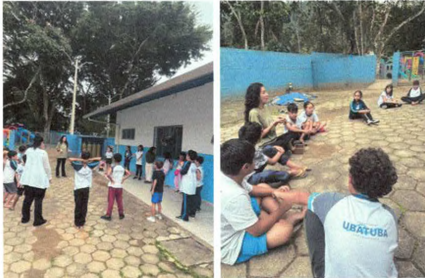
Conversa recapitulando último encontro e brincadeira “Iapo, ia ia é”.