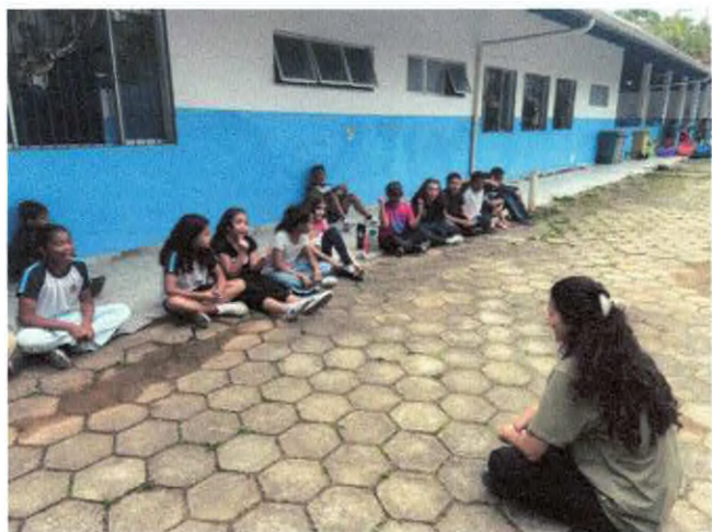
Conversa recapitulando último encontro.