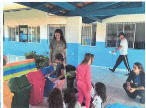
Descarte correto dos resíduos recicláveis.