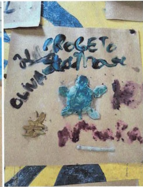
Oficina artística com elementos da natureza.