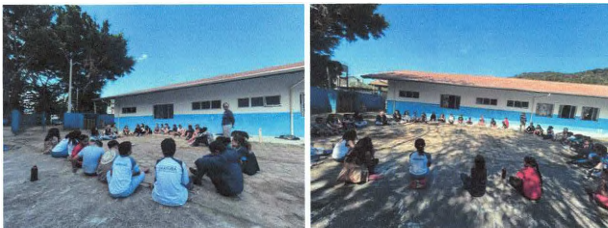
Roda de conversa com objetos de comunidades tradicionais.