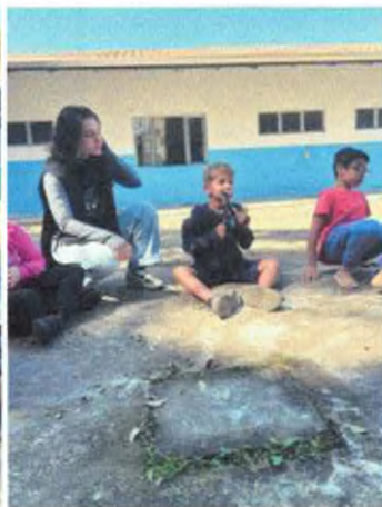
Roda de conversa com objetos de comunidades tradicionais.