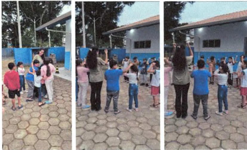
Conversa recapitulando último encontro e brincadeira "Iapo, ia ia ê".