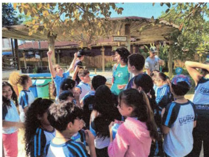
Brincadeira sobre a alimentação das tartarugas