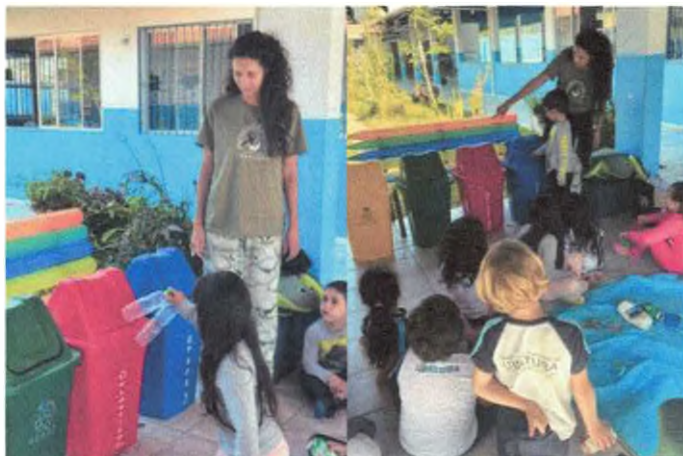
Descarte correto dos resíduos recicláveis.